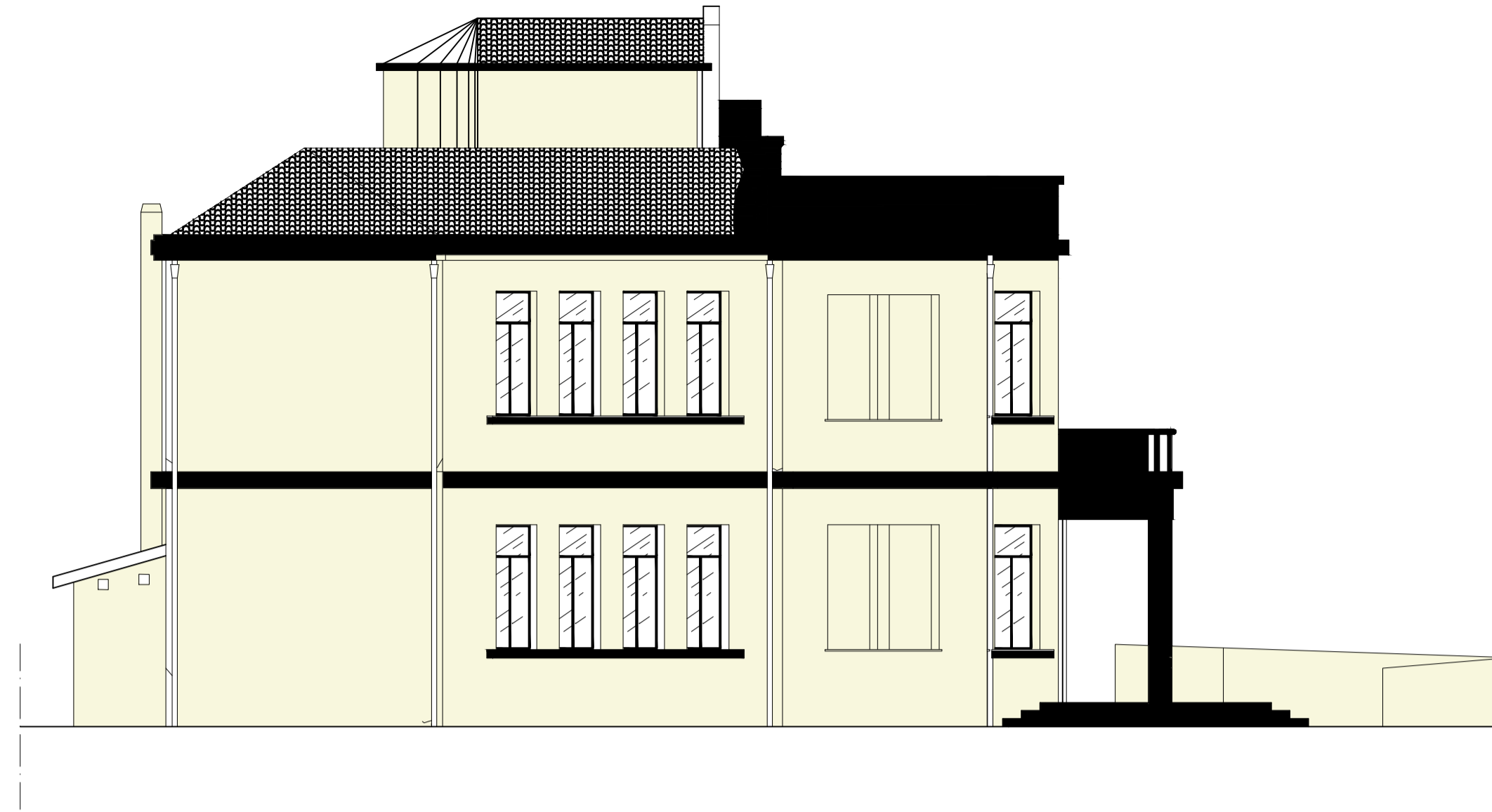
PROSPETTO LATERALE SUD EST - SCALA 1:100