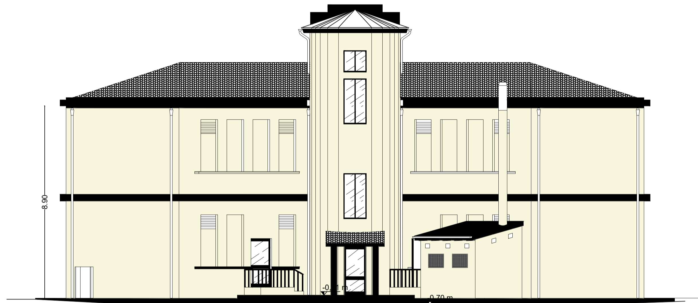
PROSPETTO TERGALE - SCALA 1:100