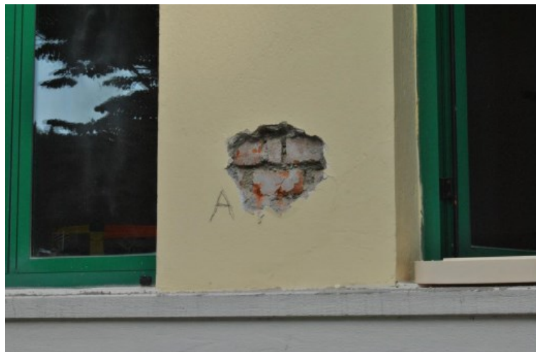
Figura 3 - Saggio A muratura tra le finestre piano terra prospetto verso via Badiani

Si riportano alcune foto fatte durante la campagna di prove.