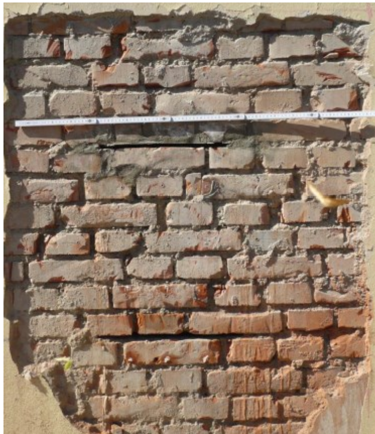
Figura 5 - Saggio F, muratura perimetrale