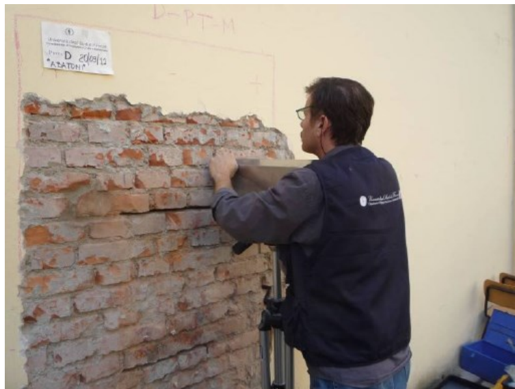
Figura 4 - Saggio D, muratura perimetrale oggetto di prove con martinetto piatto