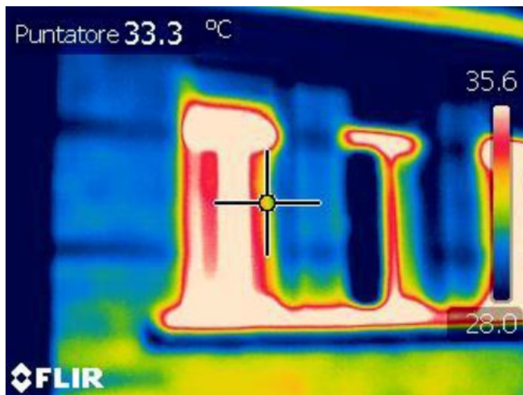
Figura 7 - Termografia