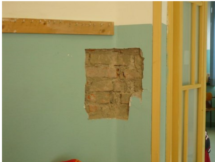
Figura 6 - Saggio L, dettaglio muratura pareti ammorsate