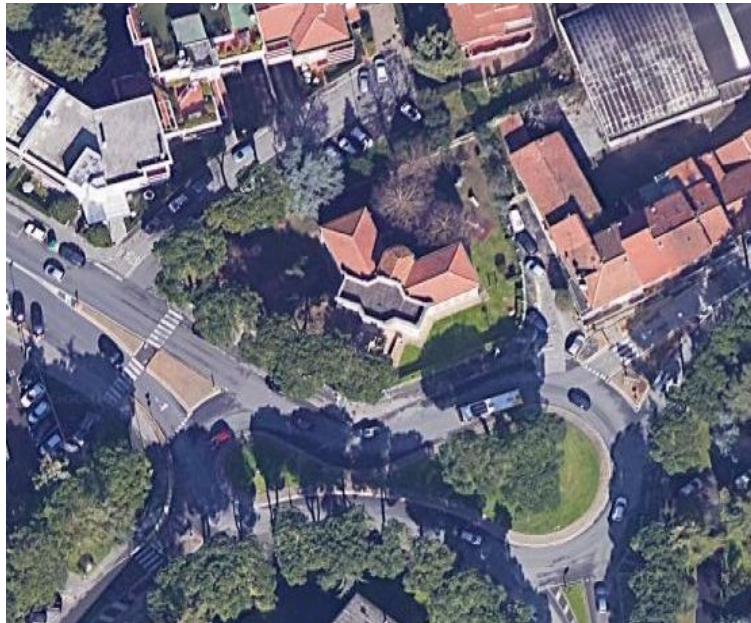
Figura 1 - Inquadramento

L'immobile è ubicato in Via Angiolo Badiani n.2, in località Santa Lucia, una frazione della città di Prato in prossimità del centro storico; è identificato al N.C.E.U. di Prato al foglio 16, part. 155 sub 500.