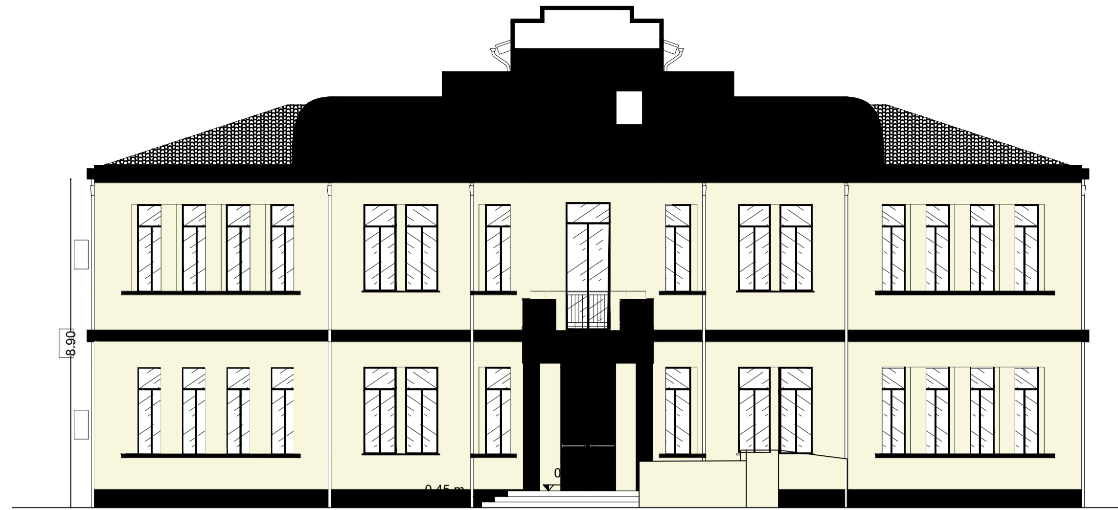
PROSPETTO FRONTALE - SCALA 1:100