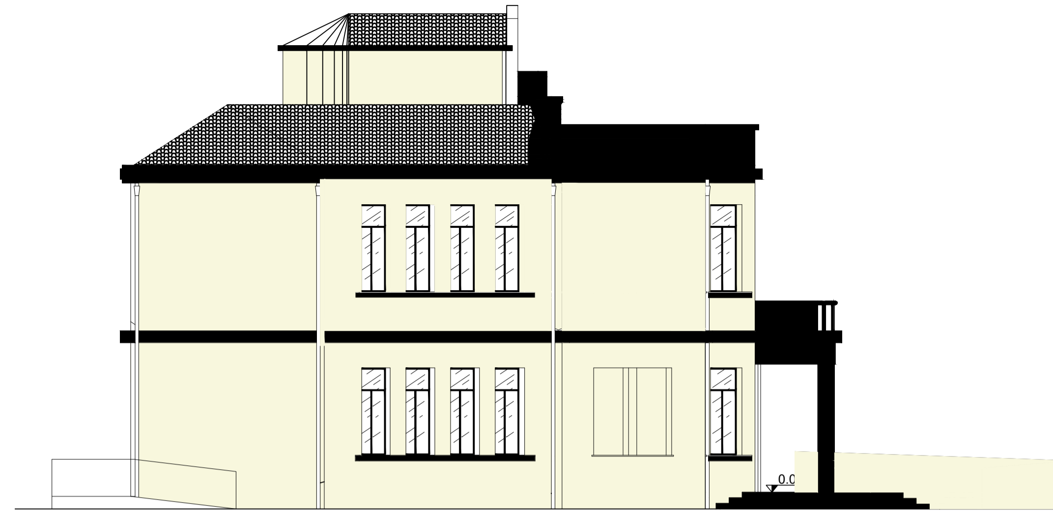
PROSPETTO LATERALE SUD EST- SCALA 1:100