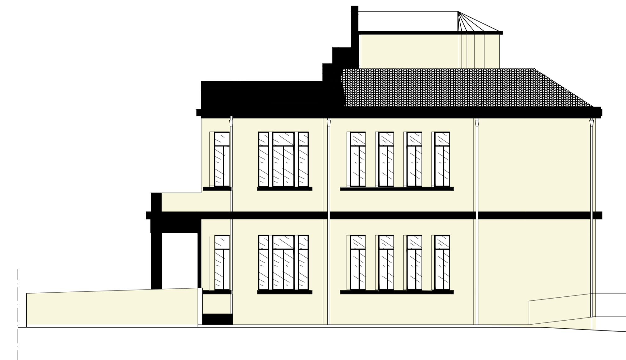
PROSPETTO LATERALE SUD OVEST- SCALA 1:100