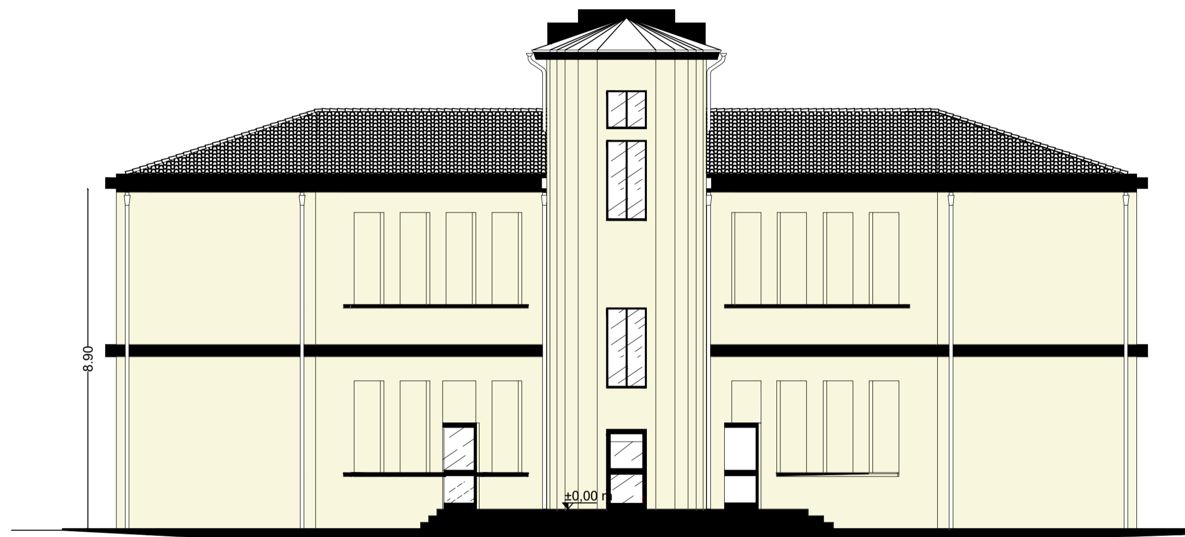
PROSPETTO TERGALE- SCALA 1:100