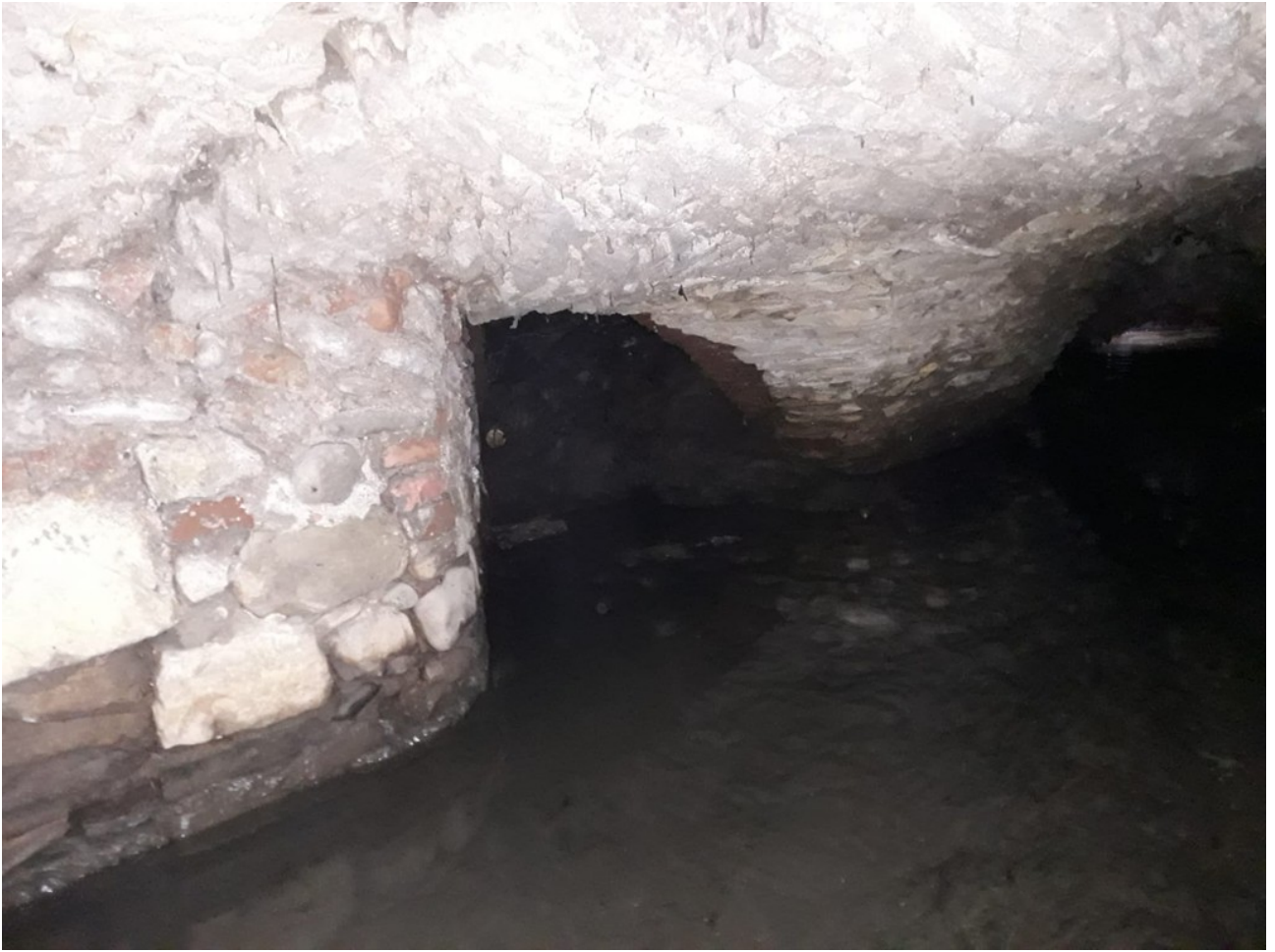
Foto 19 - Sotterranei