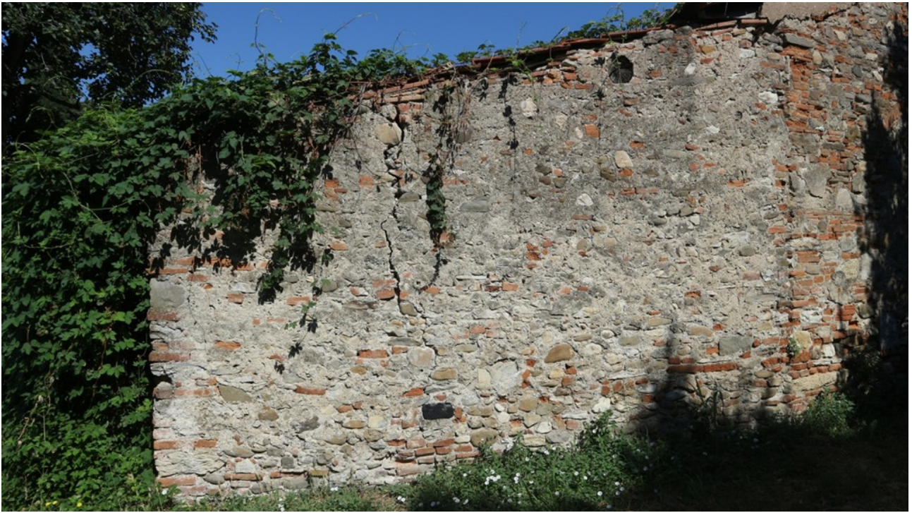
Foto 9 - Lato est prima della ripulitura