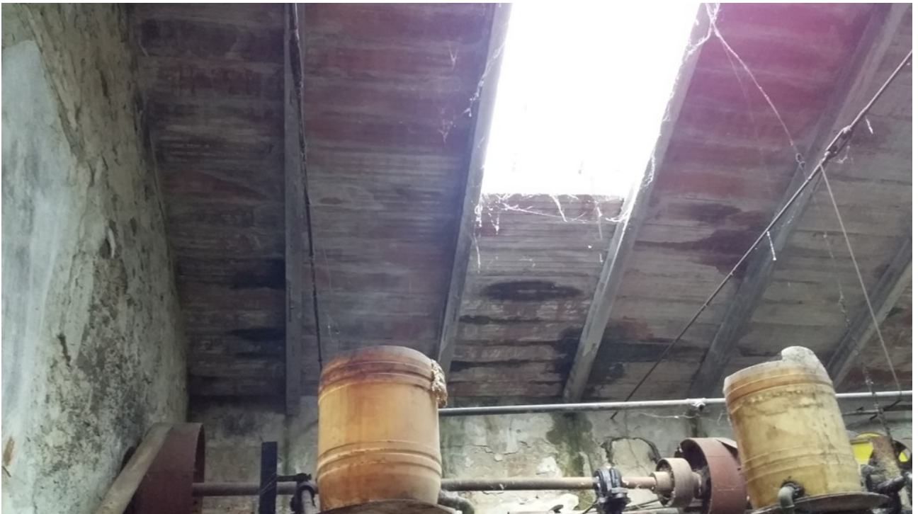
Foto 6 - Copertura locale fole