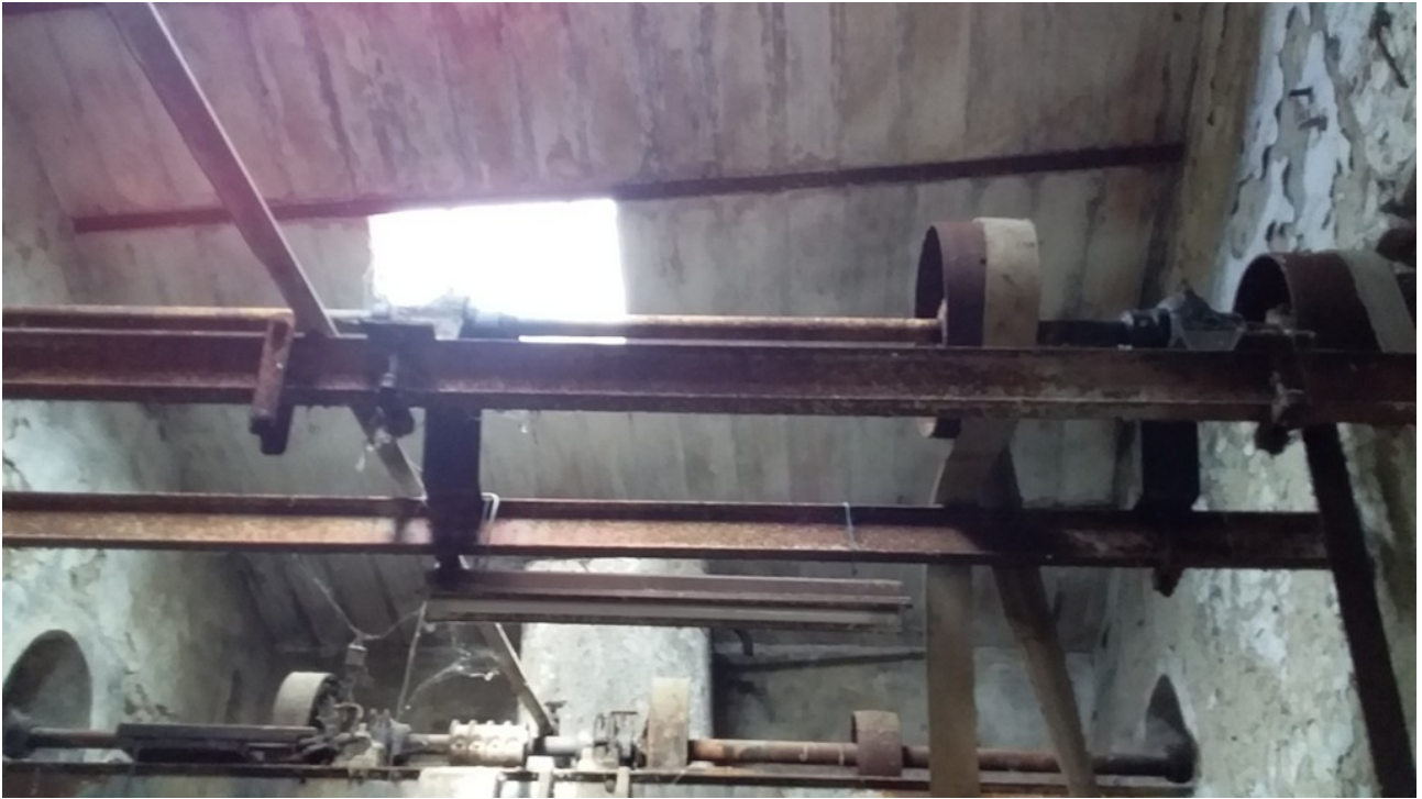
Foto 3 - Copertura locale turbine