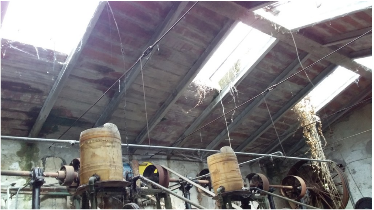
Foto 5 - Copertura locale fole