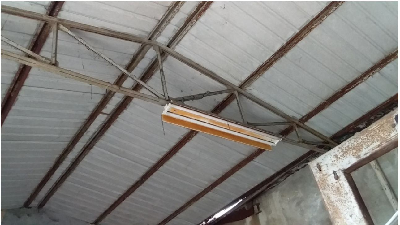
Foto 1- Copertura corpo aggiunto anni '70