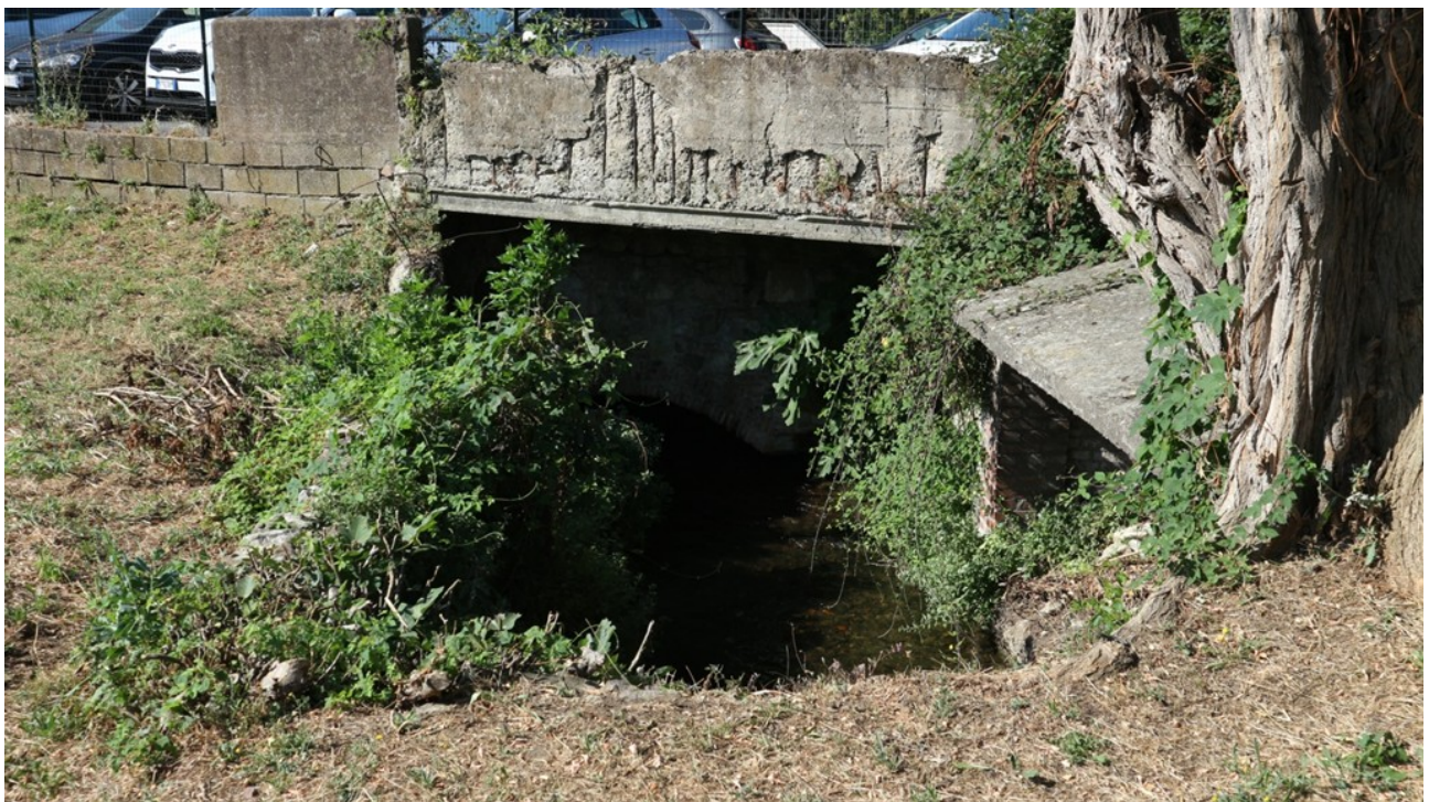
Foto 8 - Gorone in uscita. A destra il vecchio lavatoio prima della ripulitura