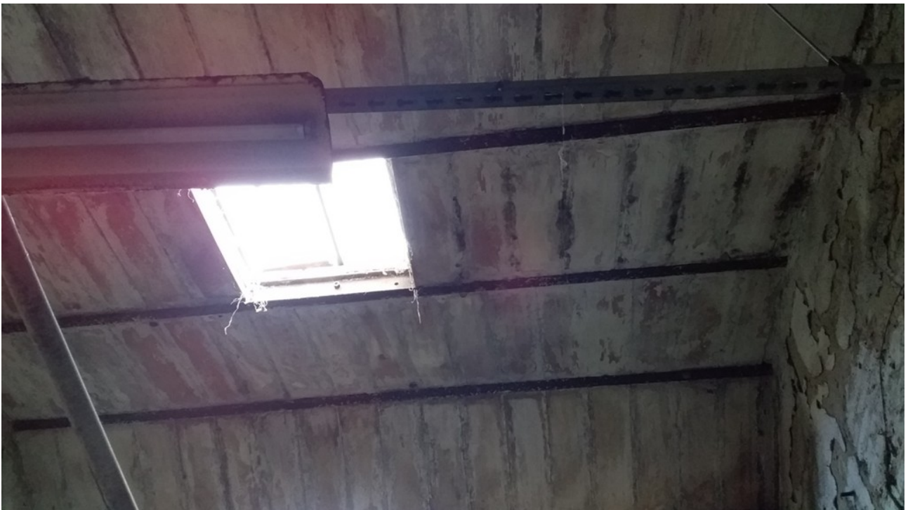
Foto 4 - Copertura locale turbine