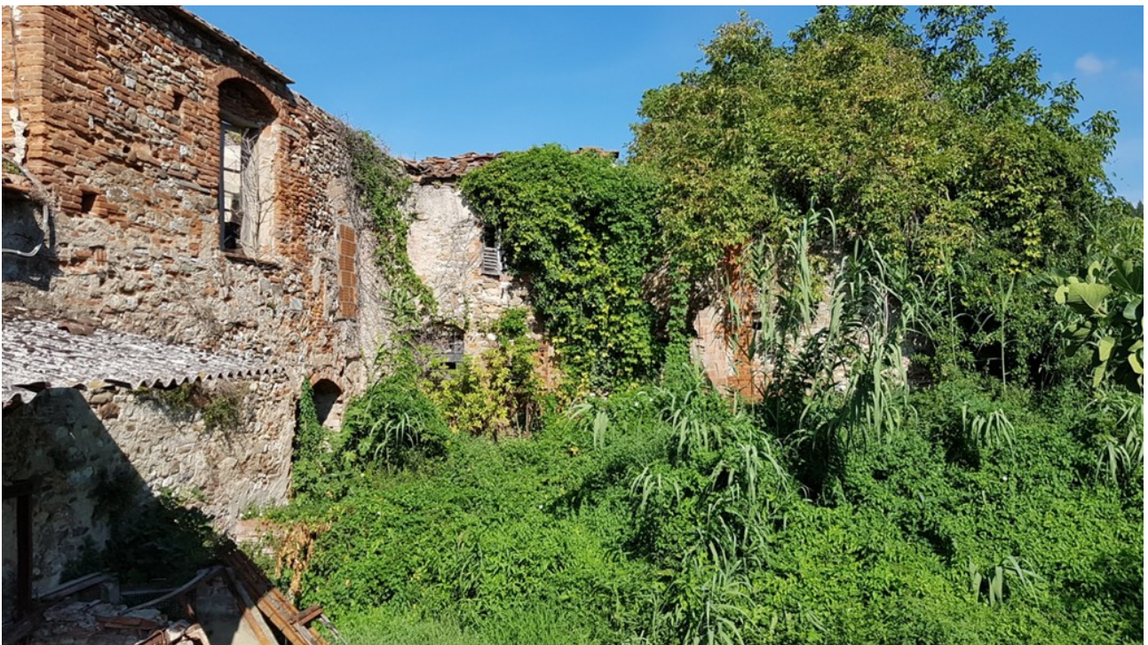
Foto 10 - Facciata tergale prima della ripulitura