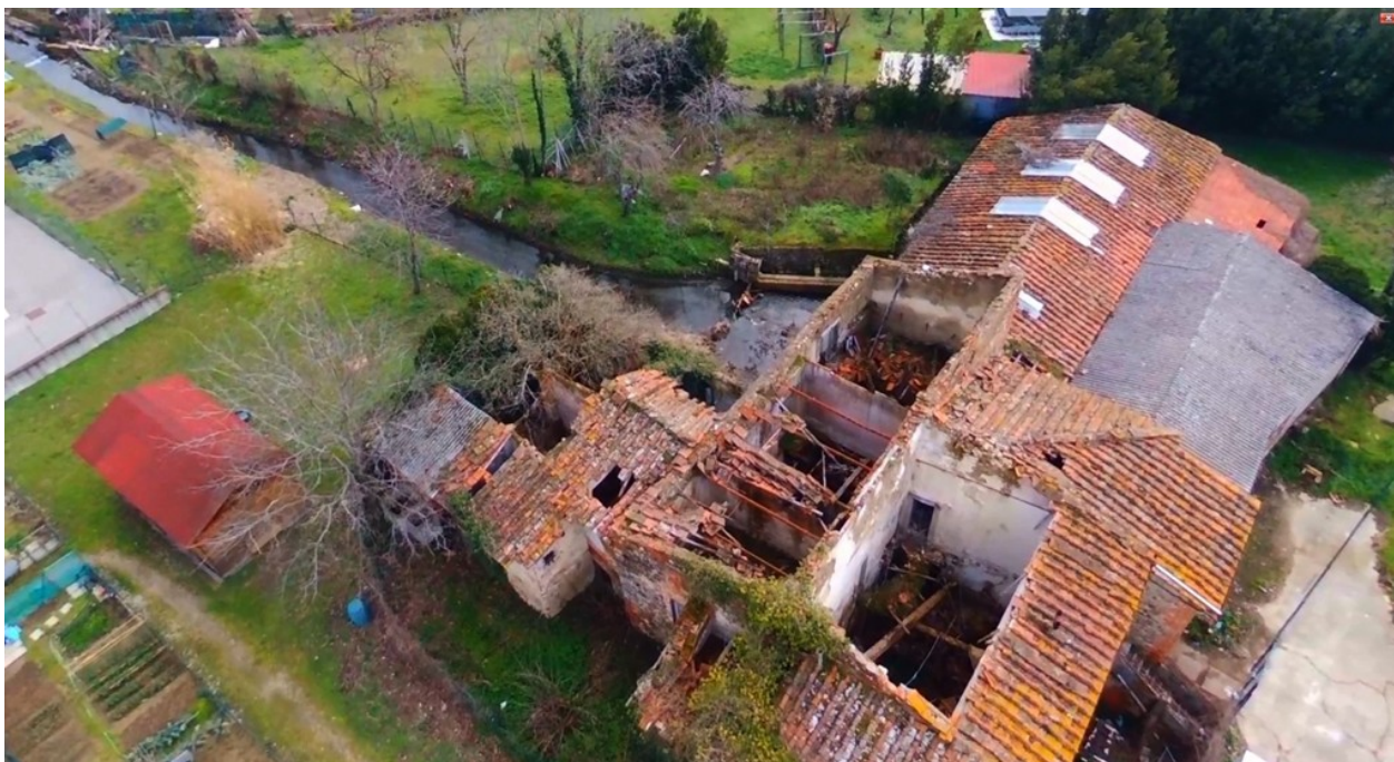
Foto 3 - Dall'alto verso nord-est