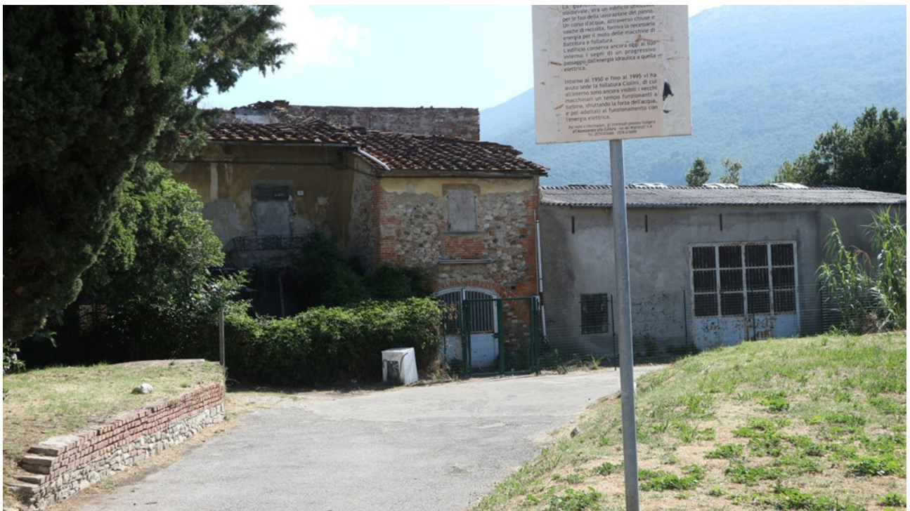
Foto 7 - Facciata anteriore. Ripresa dall'accesso carrabile