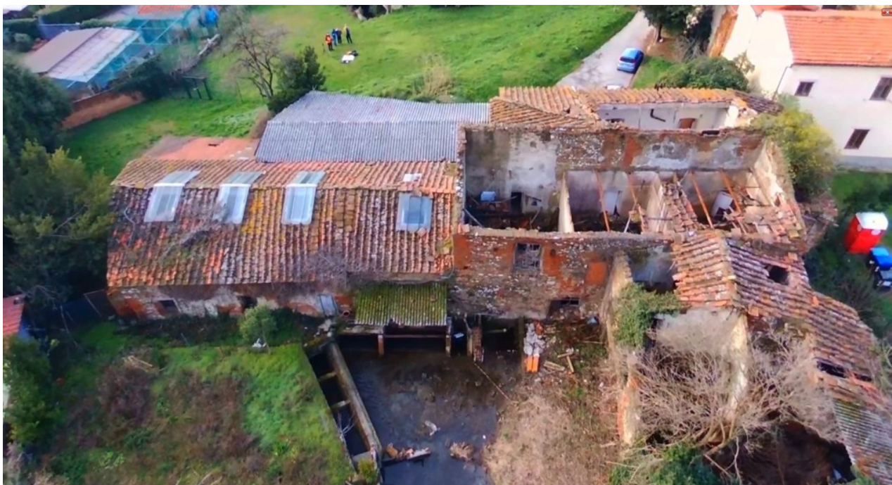
Foto 1 - Dall'alto verso sud