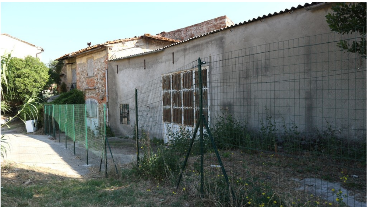
Foto 6 -Facciata anteriore. Vista d'insieme