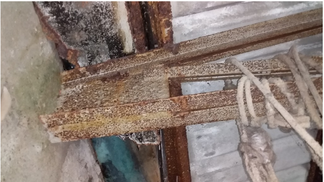
Foto 2 - Particolare appoggio capriata copertura corpo aggiunto anni '70