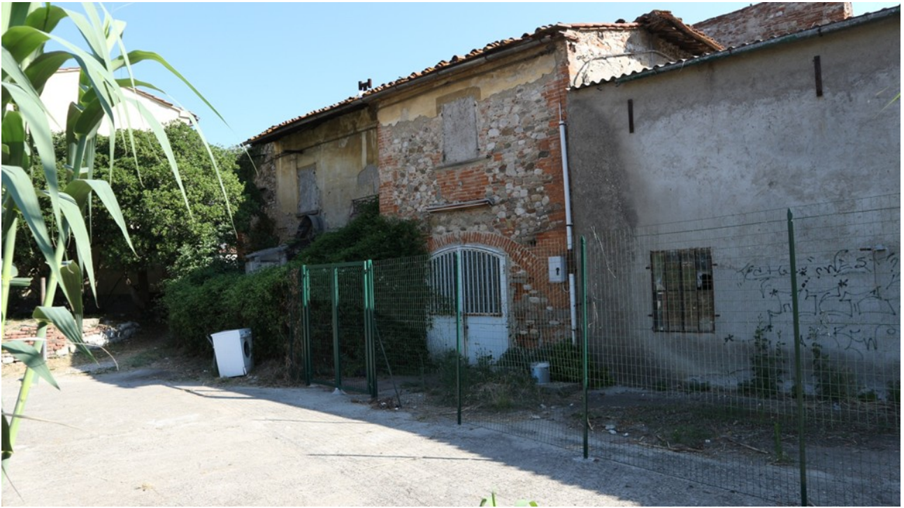
Foto 5 - Facciata anteriore: lato ovest, dietro la macchia la scala di accesso alle residenze