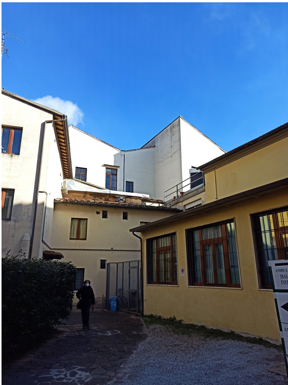
VISTA FOTOGRAFICA PROSPETTO LATERALE AMBULATORI EX OSPEDALE