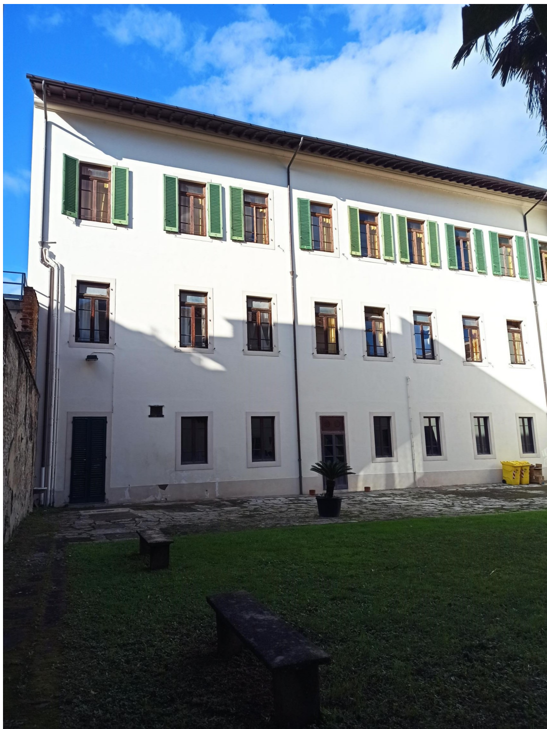
VISTA FOTOGRAFICA CORTE INTERNA 1