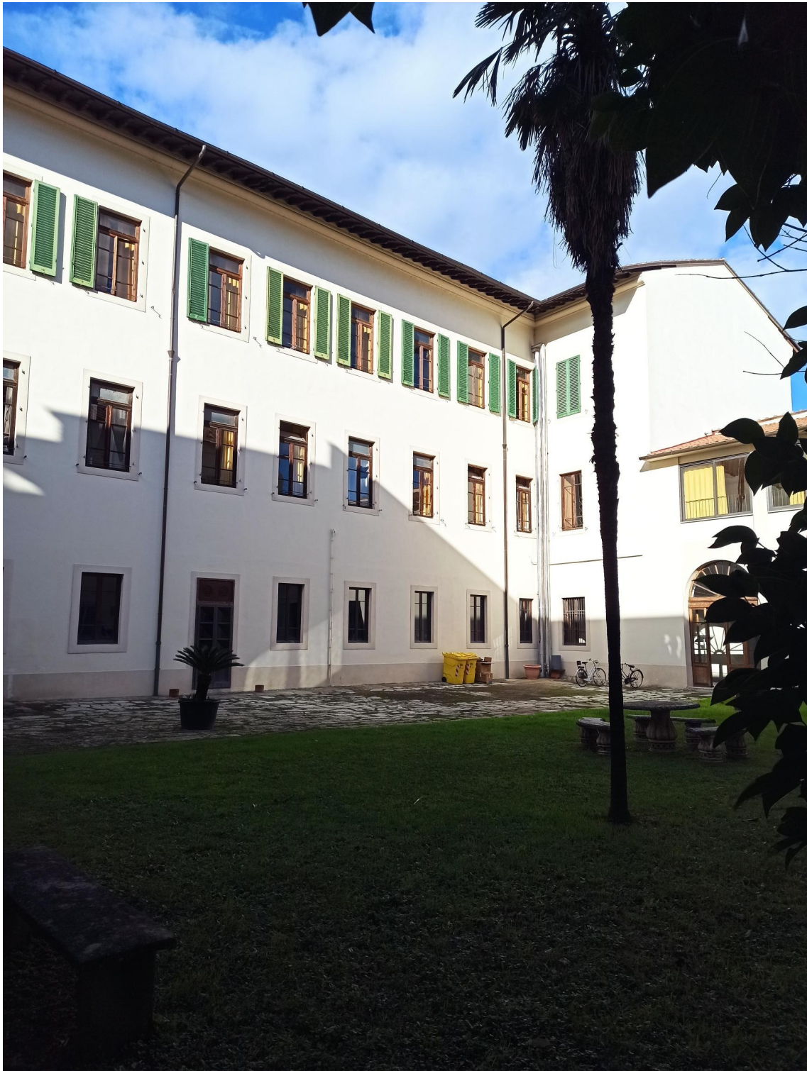
VISTA FOTOGRAFICA CORTE INTERNA 2