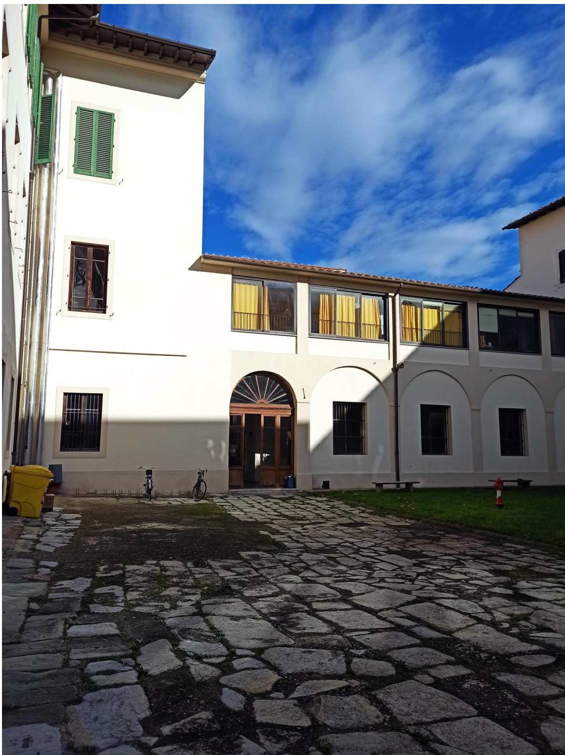
VISTA FOTOGRAFICA CORTE INTERNA 3