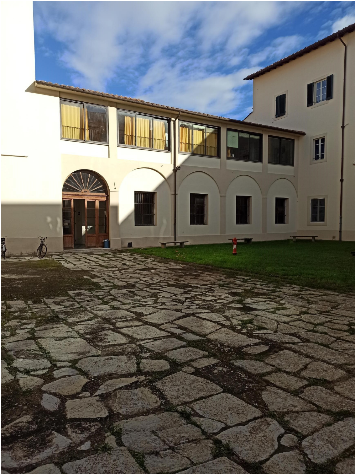
VISTA FOTOGRAFICA CORTE INTERNA 4