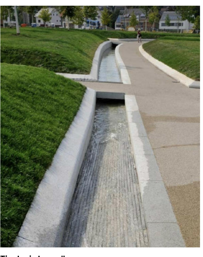
Tipologia lama d'acqua