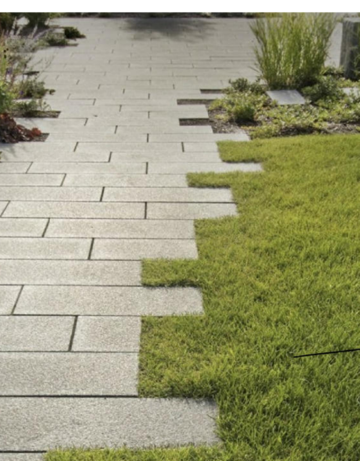
Tipologia di tipo 1: pavimentazione drenante in masselli autobloccanti in cls montati a correre e intarsi di verde