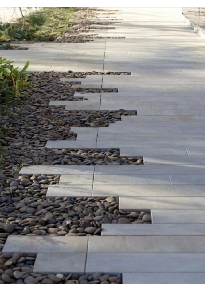
Tipologia di tipo 1: pavimentazione drenante in masselli autobloccanti in cls montati a correre