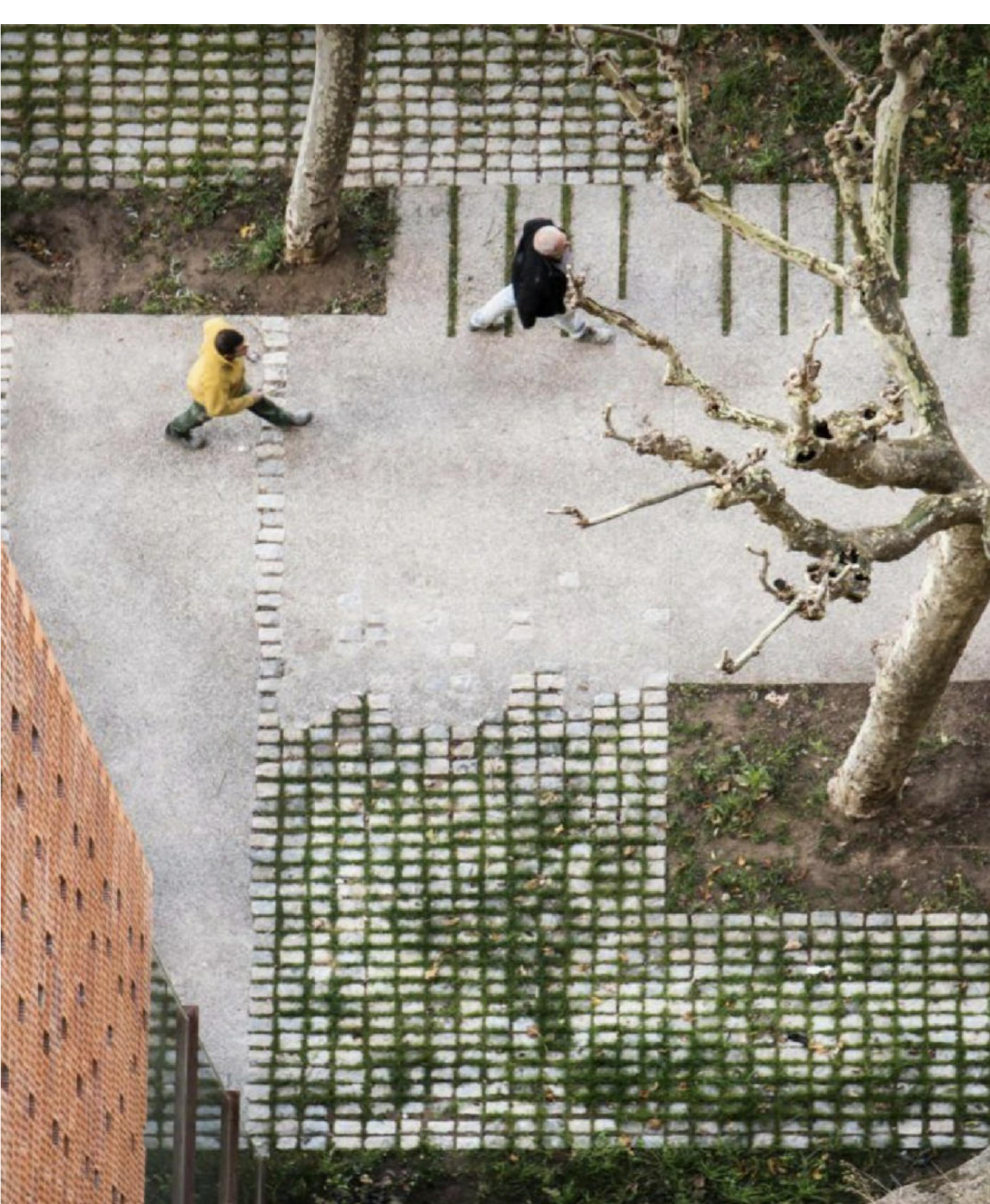
Tipologia di tipo 3: pavimentazione caratterizzata da mattonelle in cls permeabili, intarsi di verde e calcestruzzo drenante