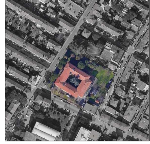
Tavola: 05 Scala: 1:100 Spazio riservato agli uffici: