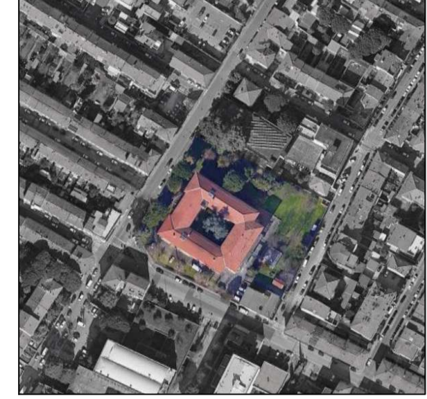
Tavola: 01 Scala: 1:100 Spazio riservato agli uffici