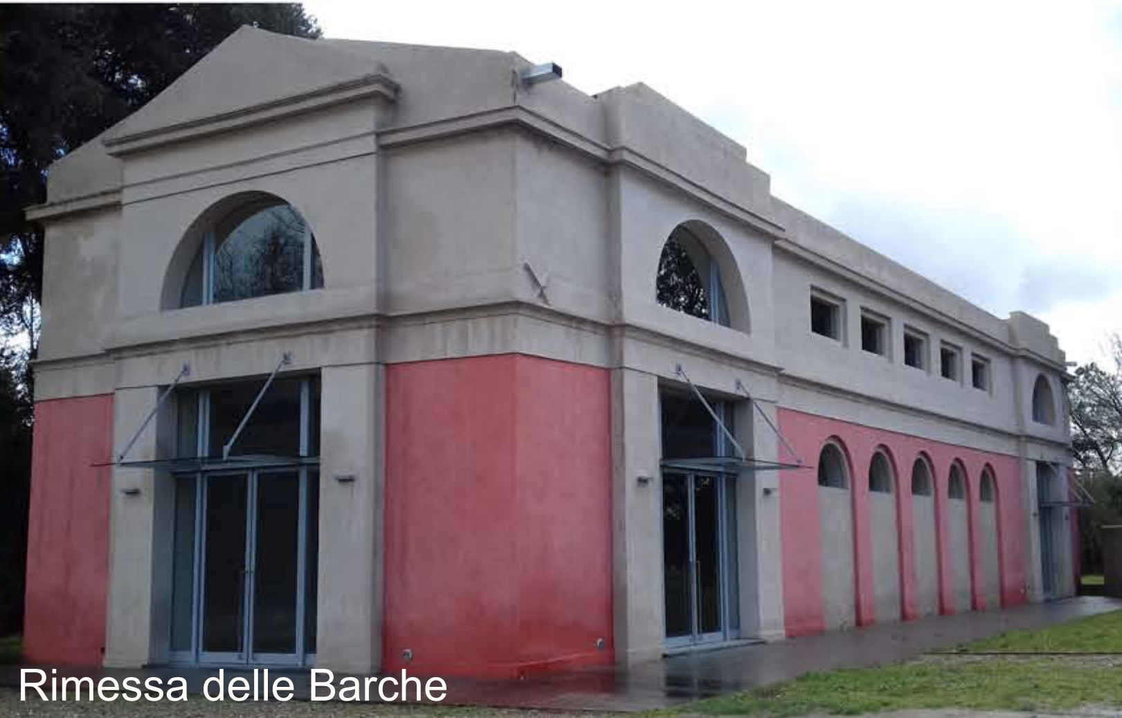
Rimessa delle Barche