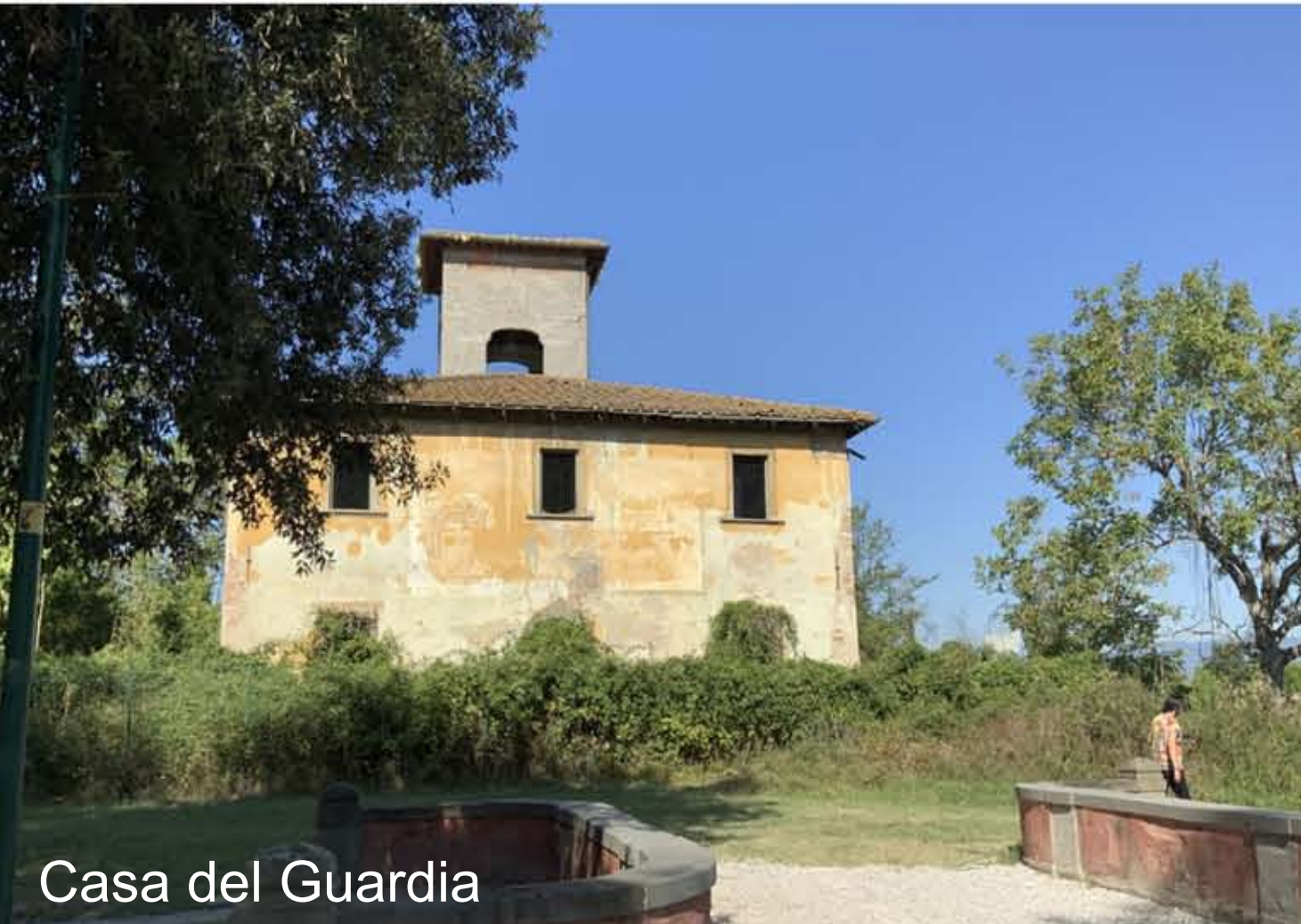
Casa del Guardia