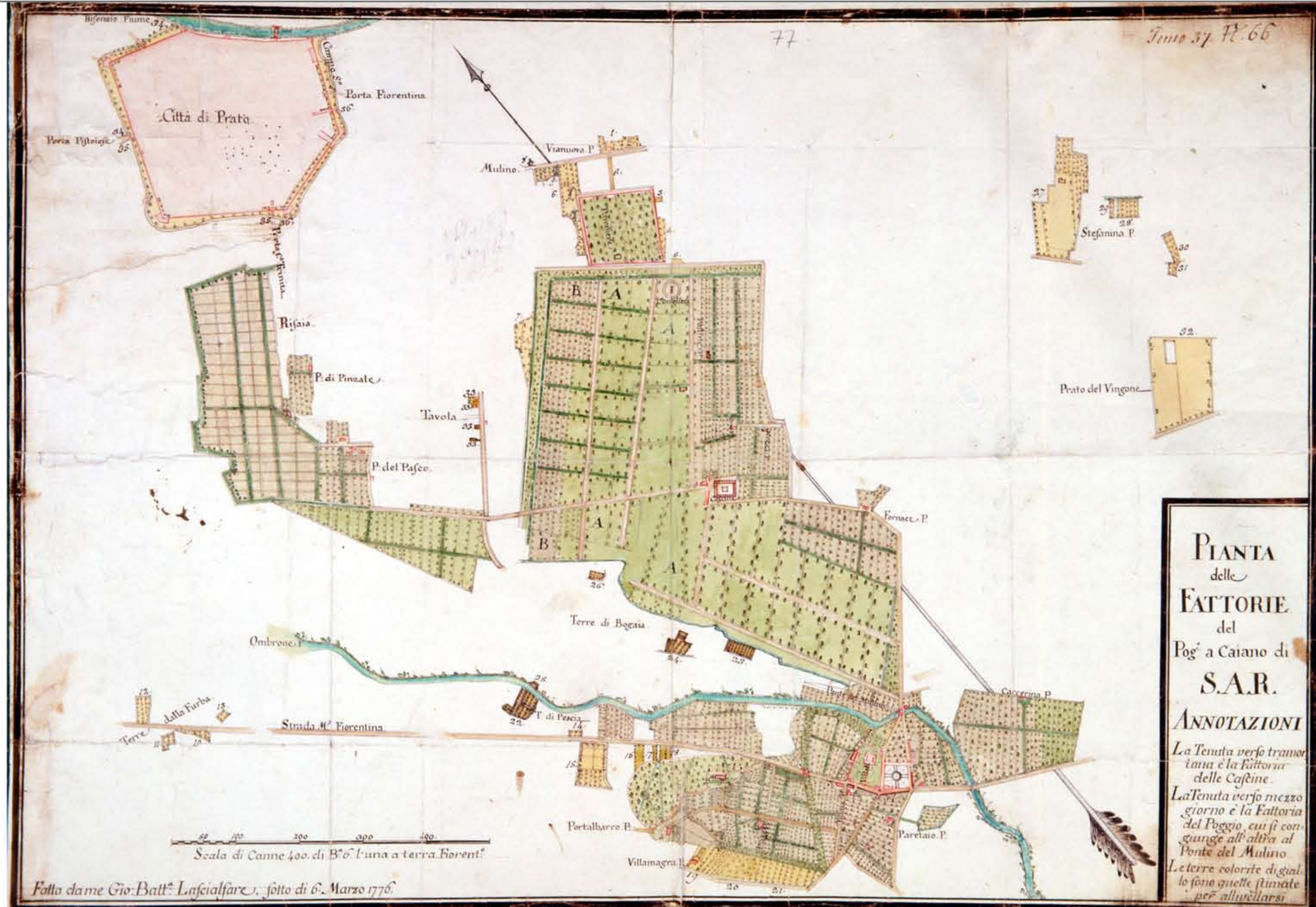
Fig.1 - Pianta della Fattoria del Poggio a Caiano e dell'abitato di Poggio a Caiano - XVIII secolo - Archivio di Stato