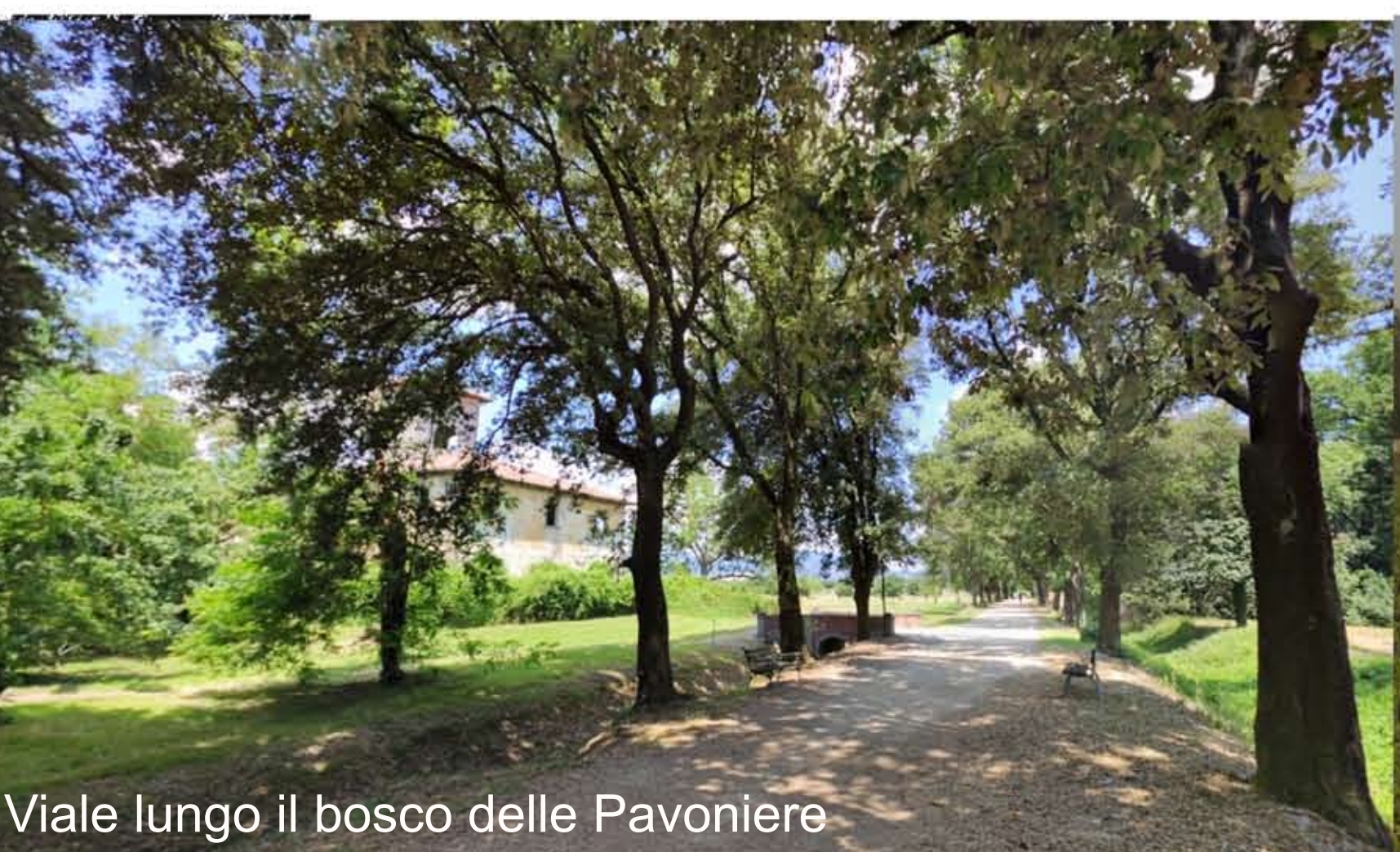
Viale lungo il bosco delle Pavoniere