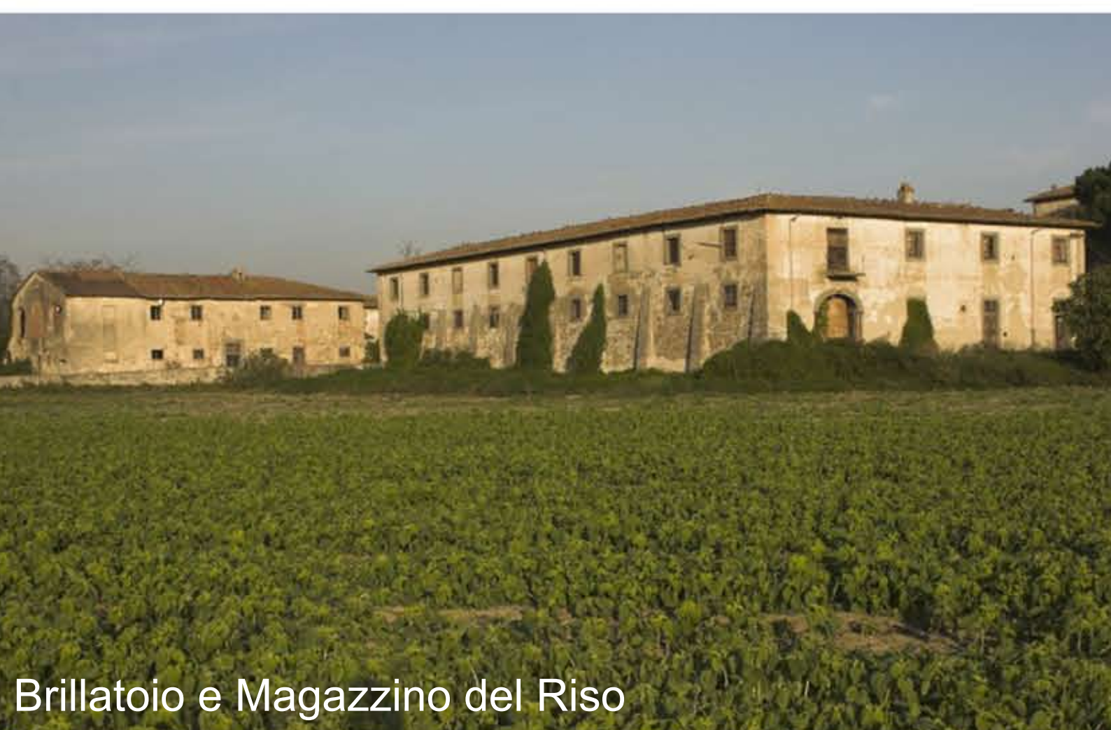
Brillatoio e Magazzino del Riso