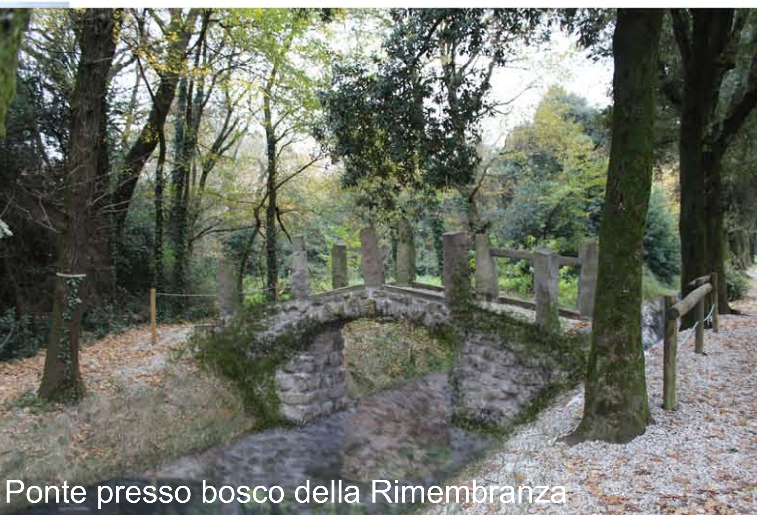
Ponte presso bosco della Rimembranza