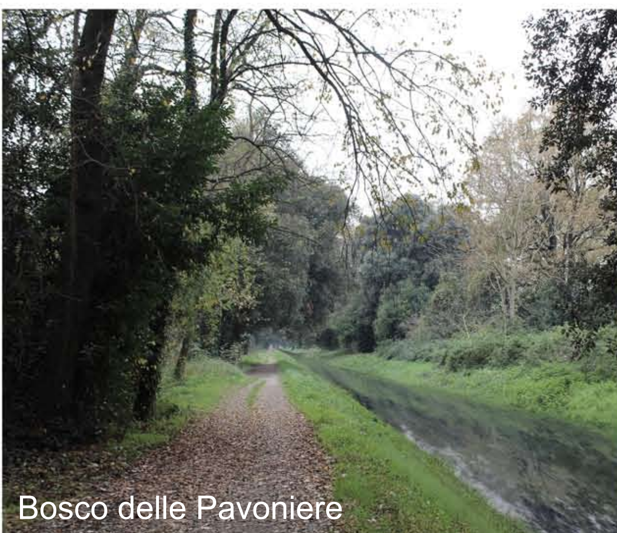
Bosco delle Pavoniere