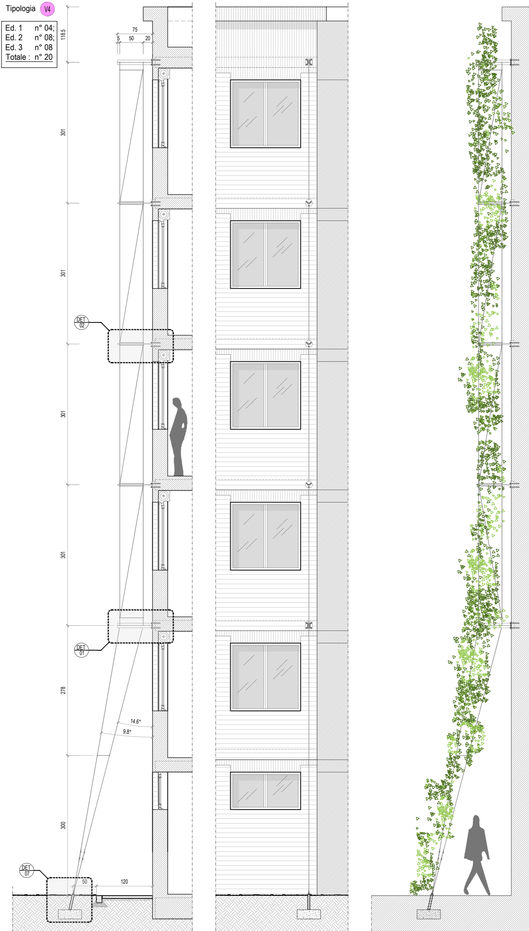
STRUTTURA PER PIANTE RAMPICANTI - Tipo V4 scala 1:50

Ed. 1 n° 04; Ed. 2 n° 08; Ed. 3 n° 08 Totale : n° 20