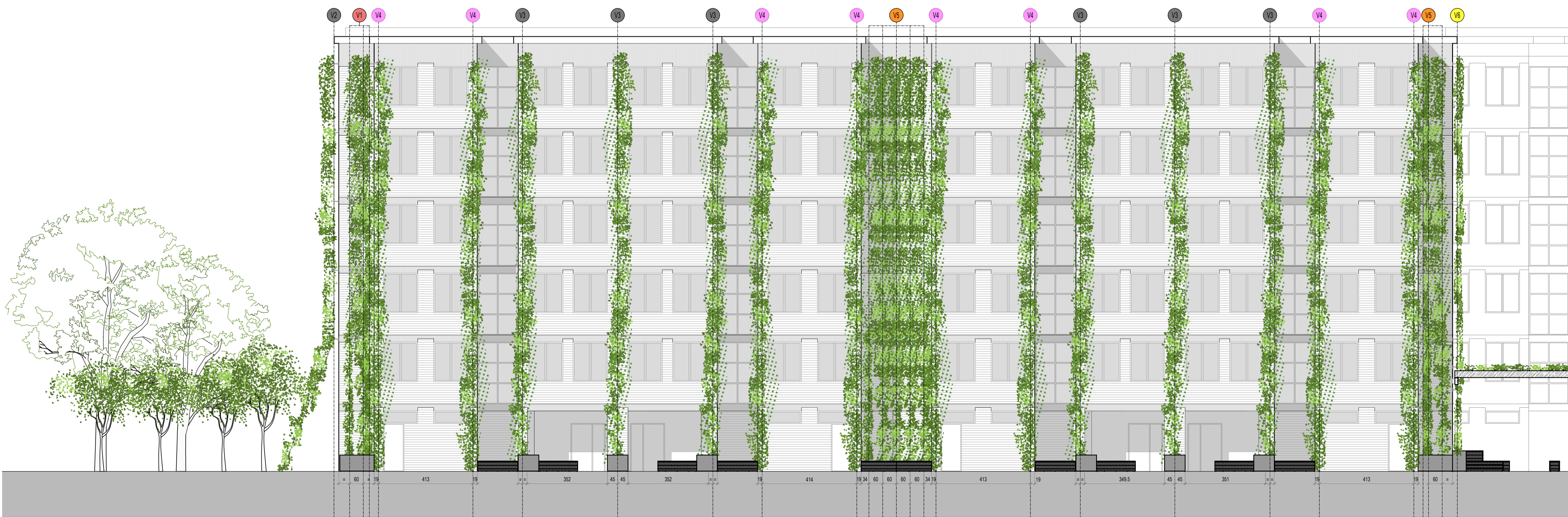
PROSPETTO SUD EDIFICIO 2 - STATO DI PROGETTO scala 1:100