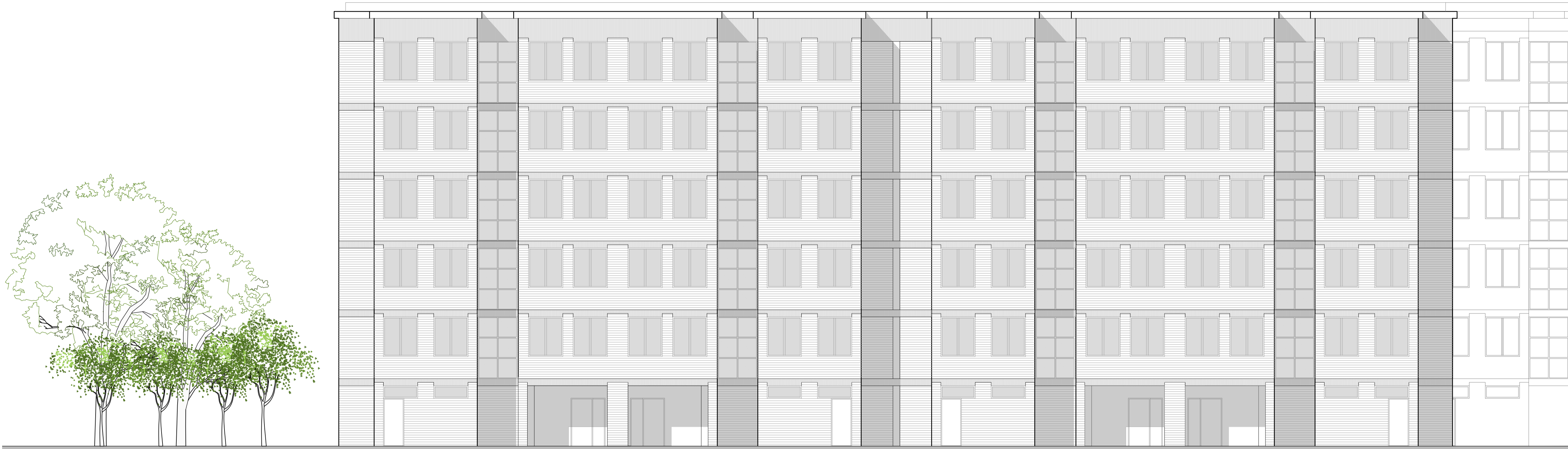
PROSPETTO SUD EDIFICIO 2 - STATO DI FATTO scala 1:100

ABBREVIAZIONI E SIMBOLI p.p.r. piano pavimento rustico p.i.f. piano inferiore ferro p.p.f. piano pavimento finito p.s.g. piano superiore grigliatolamiera p.s.f. piano superiore ferro → quote di livello riferite alla q.ta ±0.00 di progetto