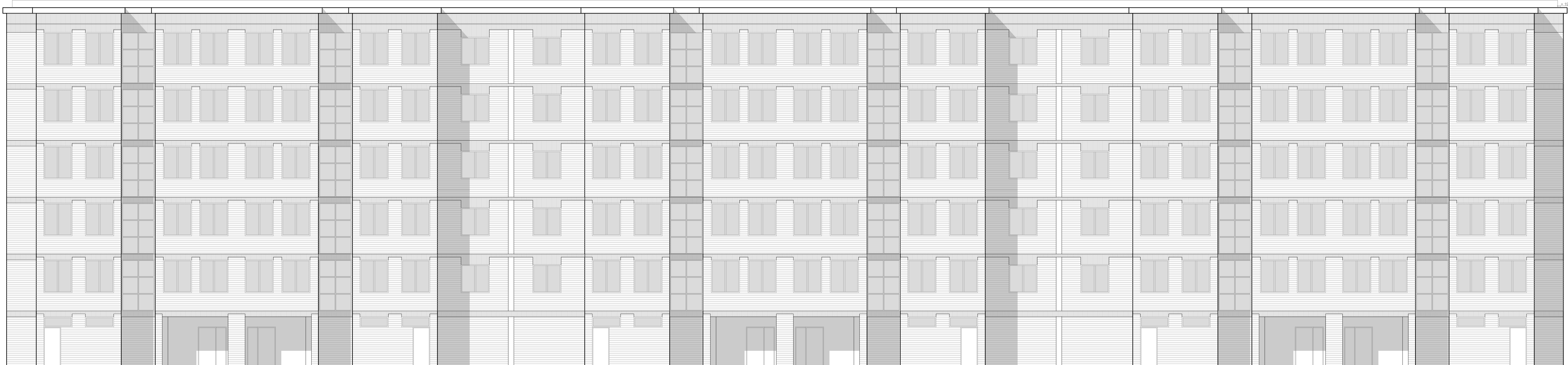
PROSPETTO SUD EDIFICIO 1 - STATO DI FATTO scala 1:100