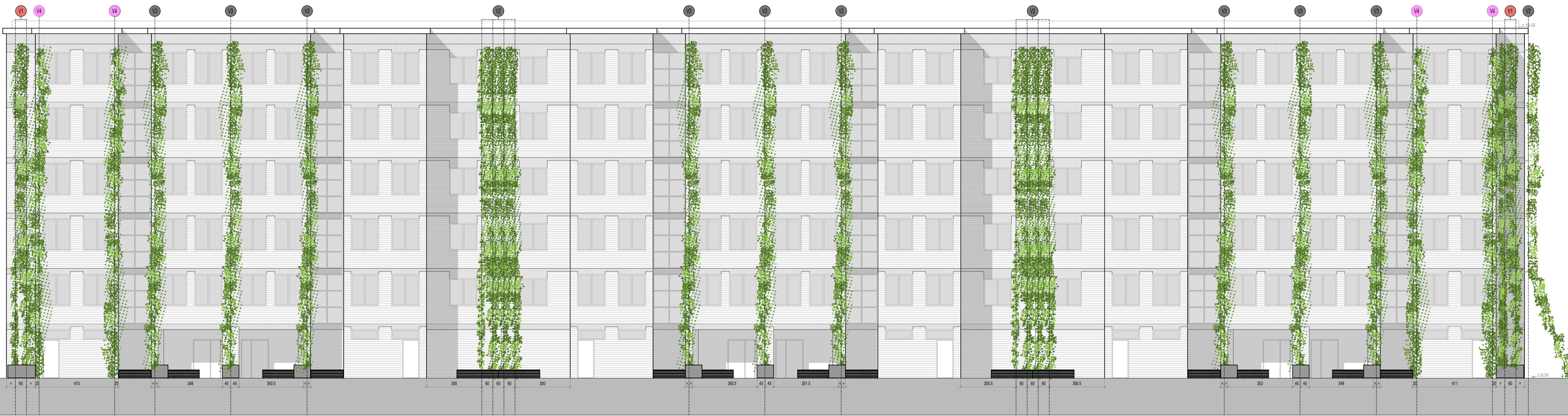
PROSPETTO SUD EDIFICIO 1 - STATO DI PROGETTO scala 1:100