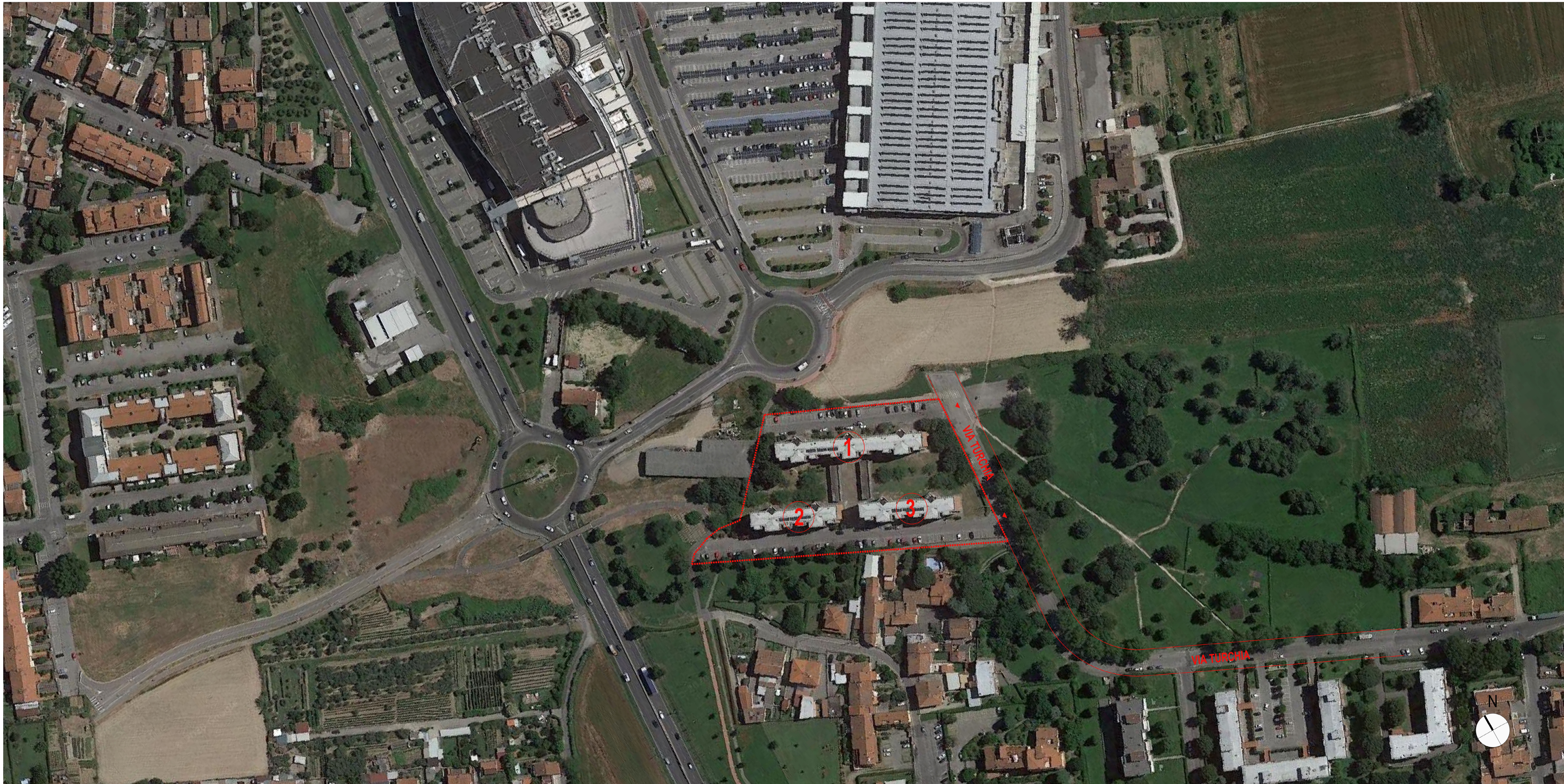
PIANTA GENERALE - UBICAZIONE INTERVENTO scala 1:1000

ABBREVIAZIONI E SIMBOLI p.p.f. piano pavimento rustico p.g.f. piano pavimento finito p.s.f. piano superiore ferro quote di livello riferite alla q.ta ±0.00 di progetto