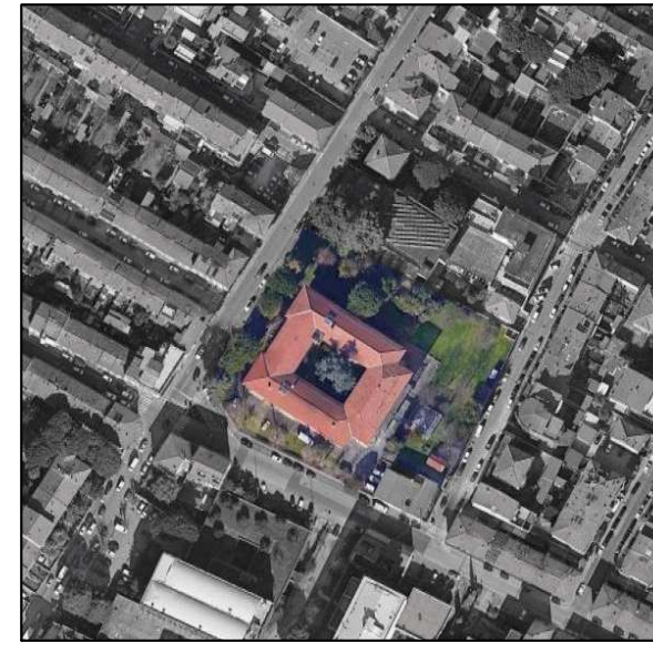
Tavola: M2 Scala: Spazio riservato agli uffici: