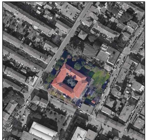
Tavola: Elab. E