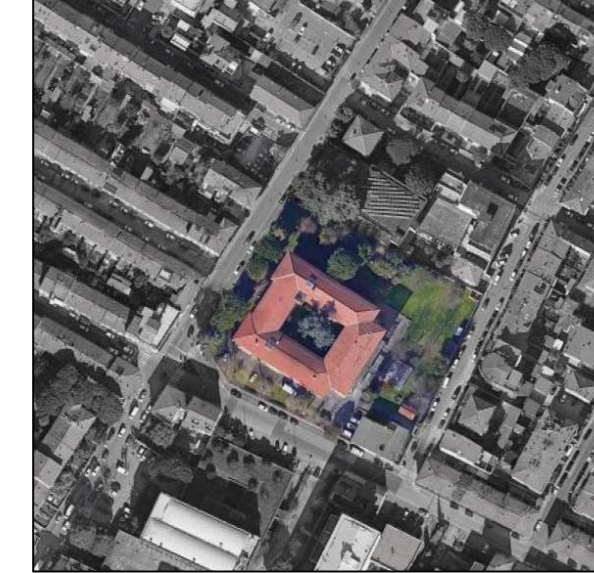
Tavola: A-25 Scala: 1:100 Spazio riservato agli uffici.