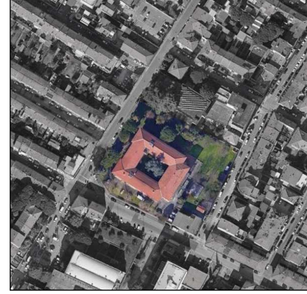
Tavola: A-24 Scala: 1:100 Spazio riservato agli uffici.