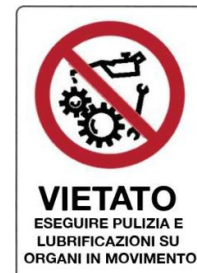
Vietato eseguire pulizia, riparazioni e lubrificazioni su organi in movimento