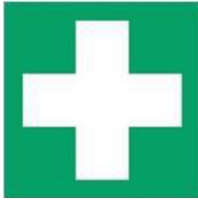
E003 - Pronto soccorso