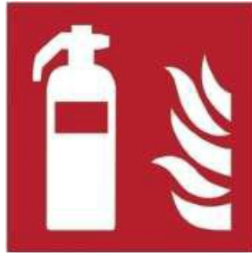
F001 - Estintore