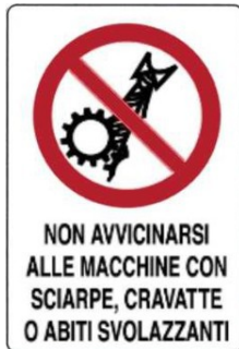
Vietato avvicinarsi alle macchine utensili con vestiti svolazzanti