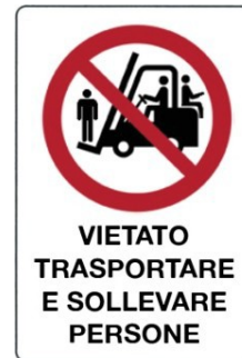
Vietato trasportare e sollevare persone