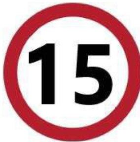
Velocità massima in cantiere di 15 km/h