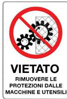
Vietato rimuovere le protezioni dalle macchine e utensili