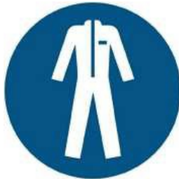
M010 - Indossare indumenti protettivi