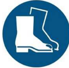
M008 - Indossare calzature di sicurezza