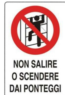
Vietato salire o scendere dai