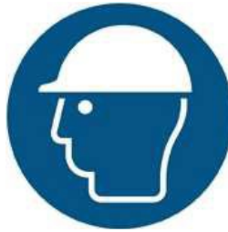
M014 - Indossare casco di protezione