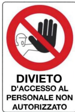
Divieto d'accesso al personale non autorizzato