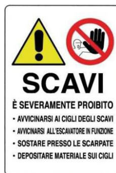
Divieto di accedere o sostare in prossimità di scavi