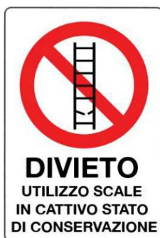
Divieto di utilizzo scale in cattivo stato di conservazione