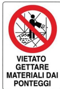
Vietato gettare materiali dai ponteggi