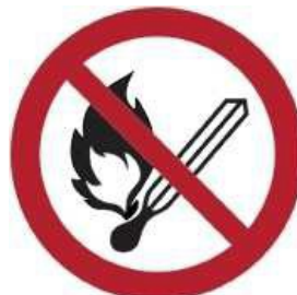
P003 - Vietato usare fiamme libere