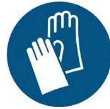
M009 - Indossare guanti protettivi