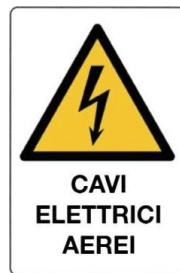
Cavi elettrici aerei