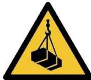
W015 - Carichi sospesi