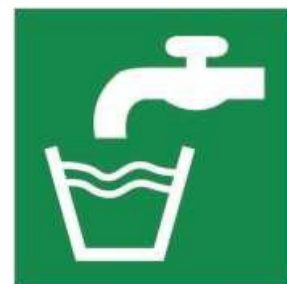
E015 - Acqua potabile