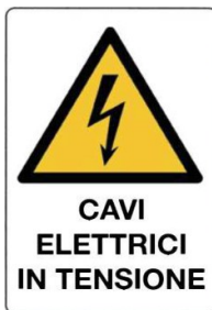
Cavi elettrici in tensione