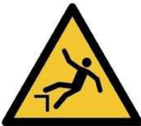
W008 - Caduta con dislivello