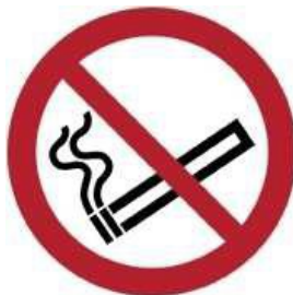
P002 - Vietato fumare