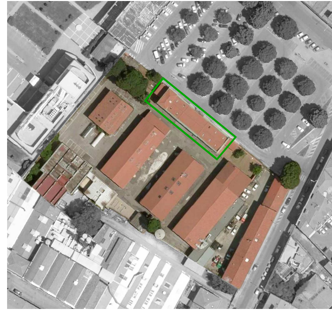
Tavola: A - 02

Legenda codici A - opere architettoniche Sic - sicurezza De - diagnosi energetica Ac - valutazioni acustiche