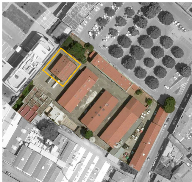
Tavola: A - CME