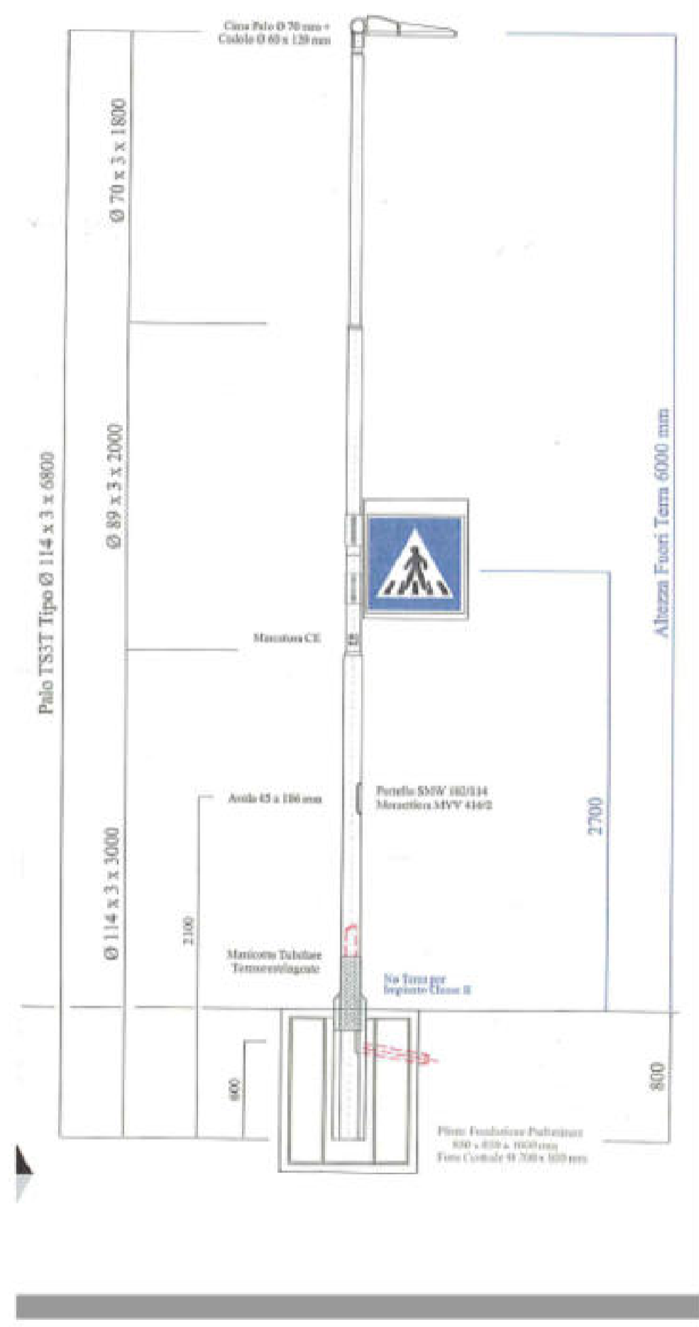
SISTEMA PER ILLUMINAZIONE ATTRAVERSAMENTO PEDONALE SCHEMA E PARTICOLARE PALI