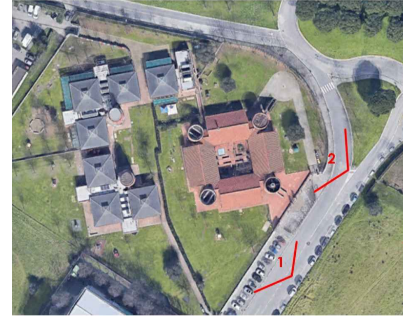
Foto esterne lungostrada