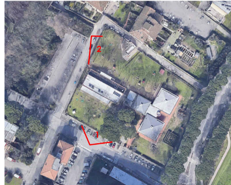
Foto esterne lungostrada