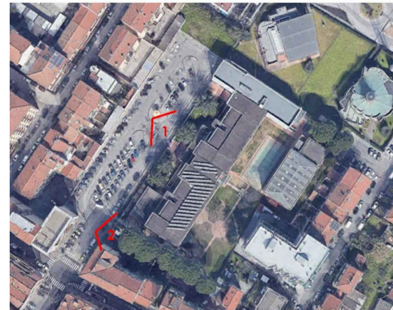
Foto esterne lungostrada