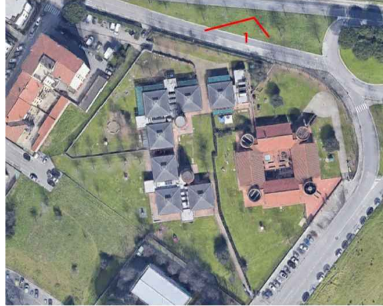
Foto esterne lungostrada