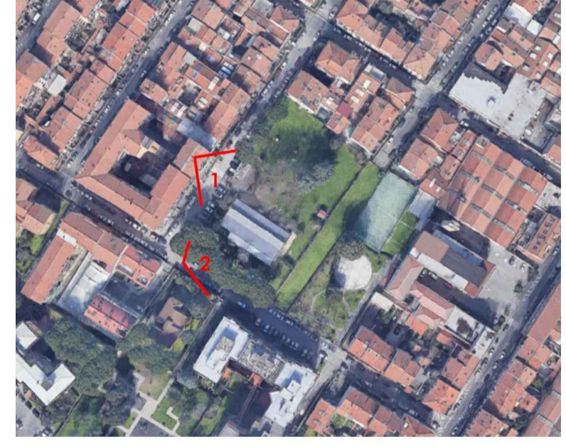
Ortofoto di inquadramento dell'area