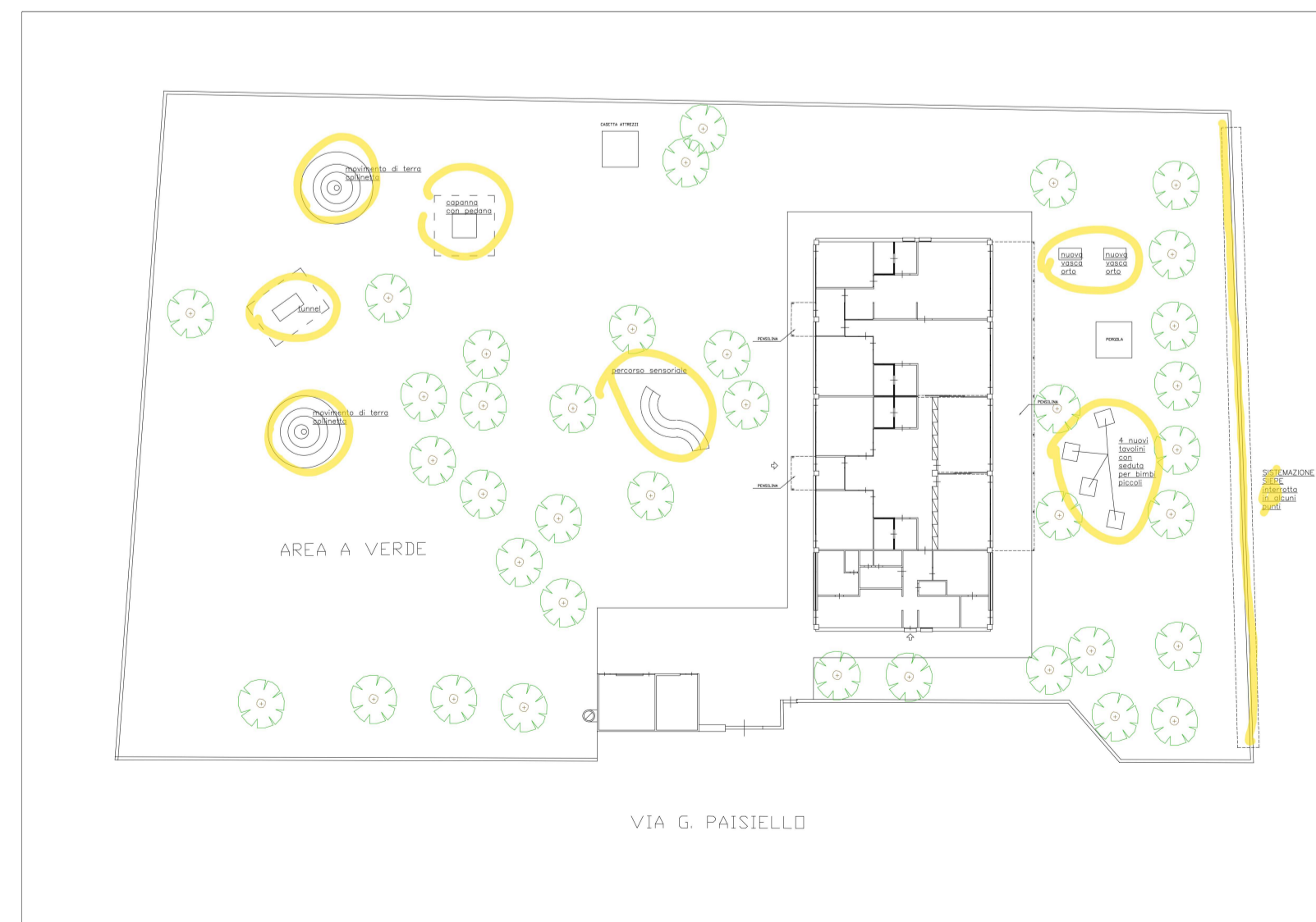
LAYOUT AREA DI INTERVENTO

© Copyright Comune di Prato - Servizio Urbanistica, Transizione Ecologica e Protezione Civile è vietata la riproduzione anche parziale del documento data Dicembre 2022