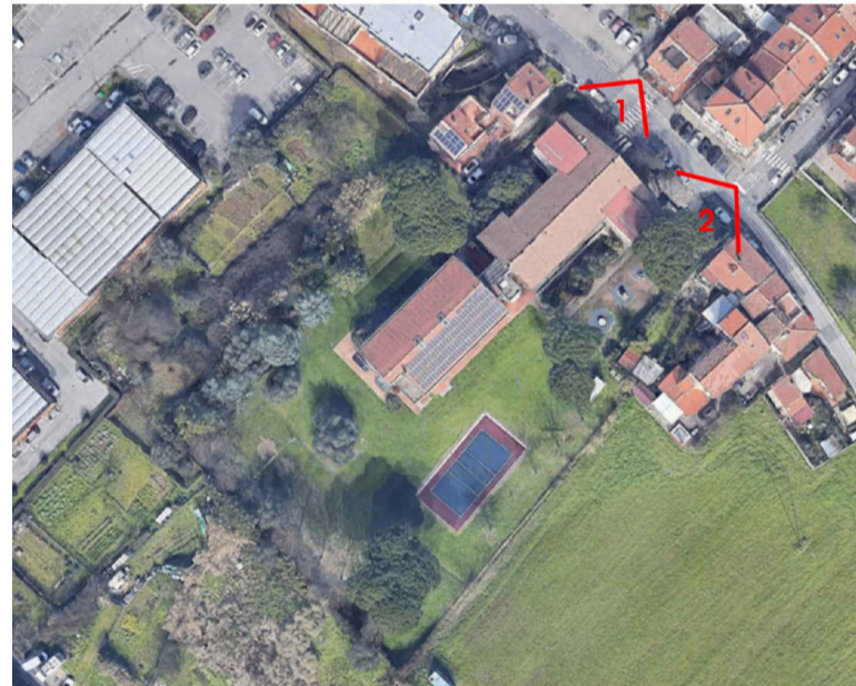
Foto esterne lungostrada