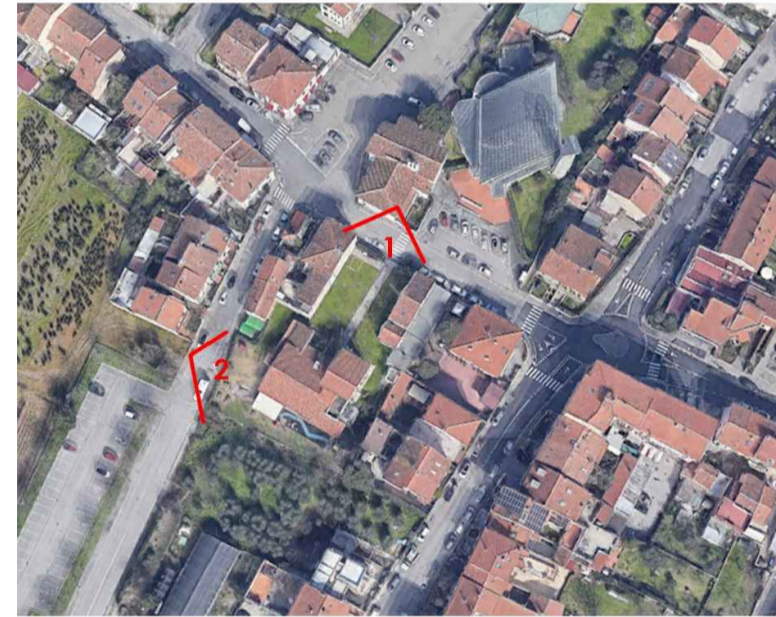
Foto esterne lungostrada