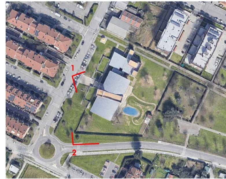
Foto esterne lungostrada