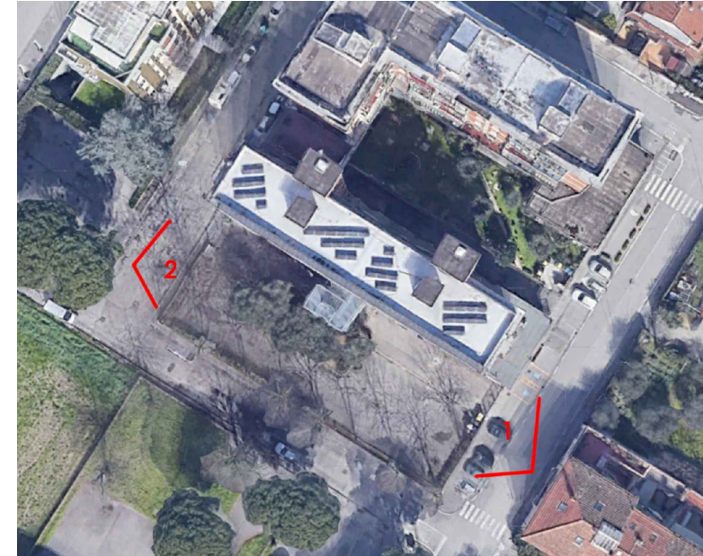
Foto esterne lungostrada