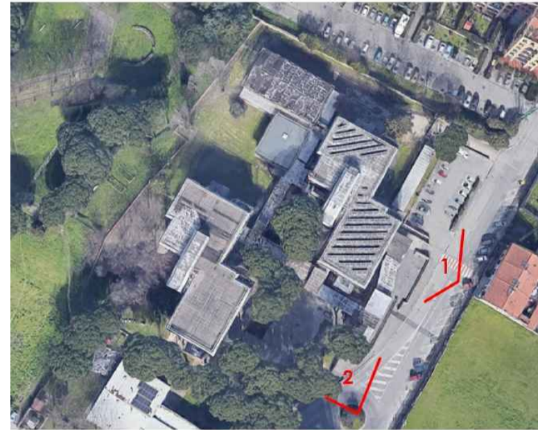
Foto esterne lungostrada