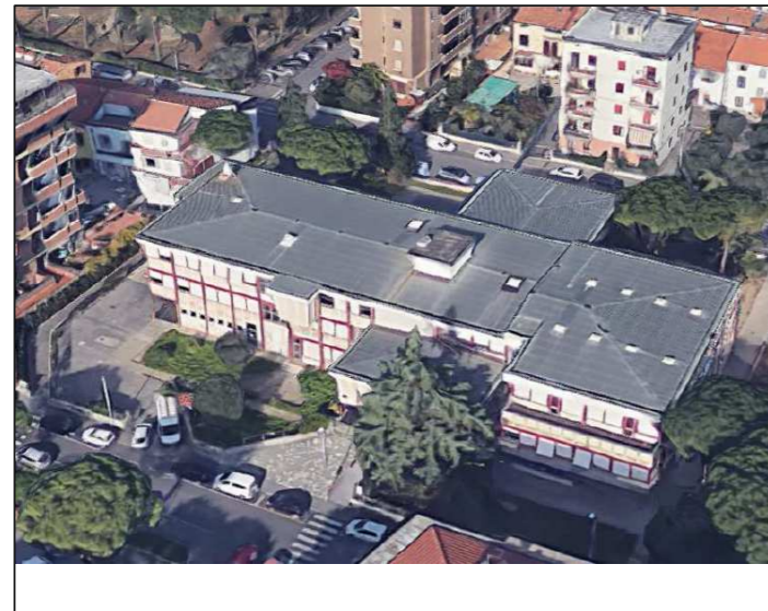
Tavola 1 - Inquadramento dell'intervento