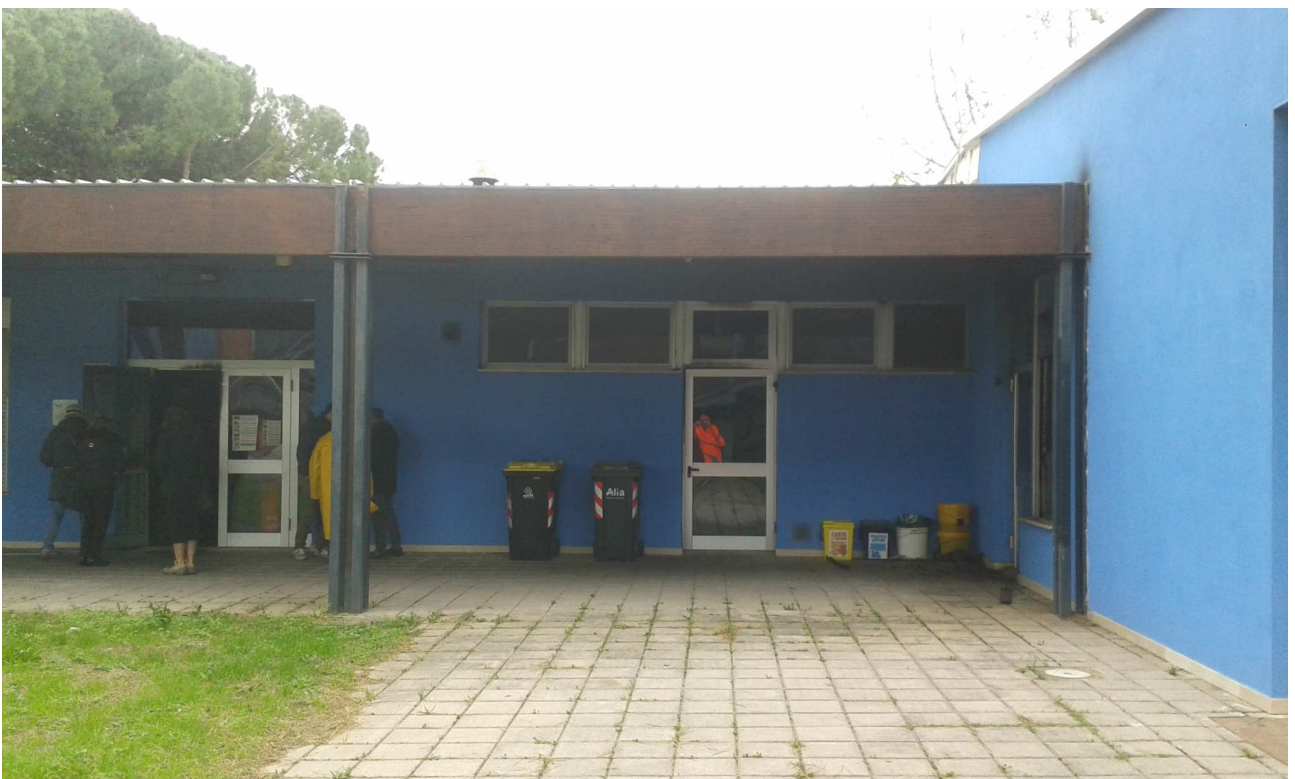
FOTO 2_Ingresso edificio