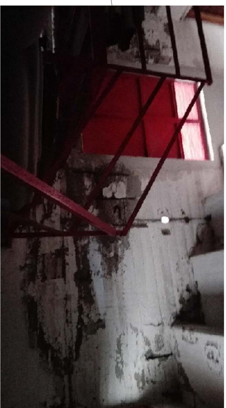
Particolare porzione muratura soggetta a risanamento