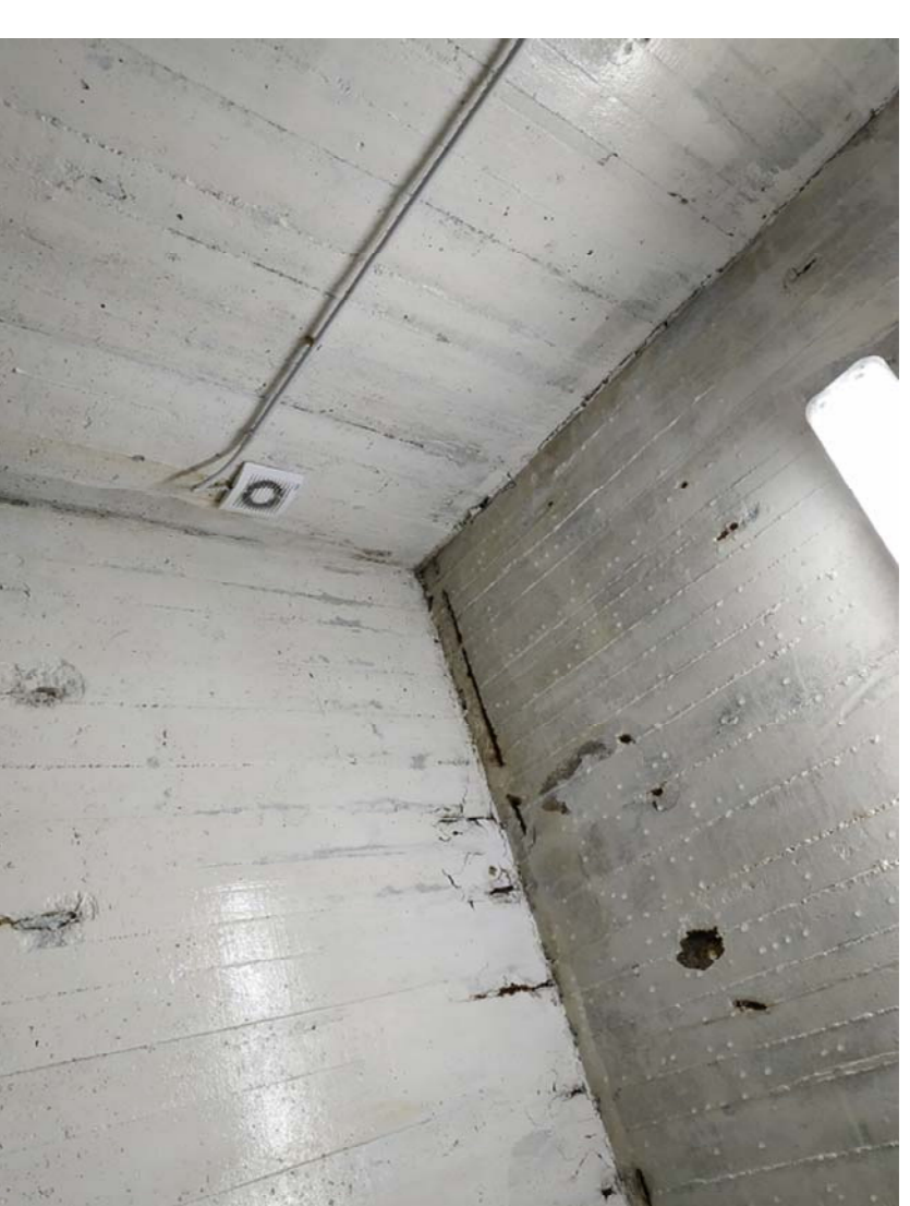
Particolare locale ripostiglio attuale ventola di aspirazione