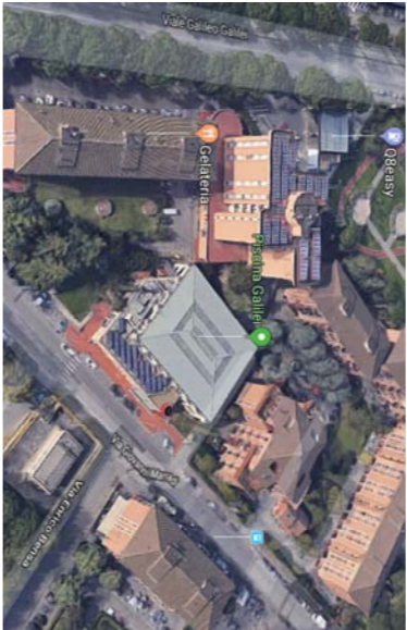
TAVOLA 5 Piano di sicurezza e coordinamento