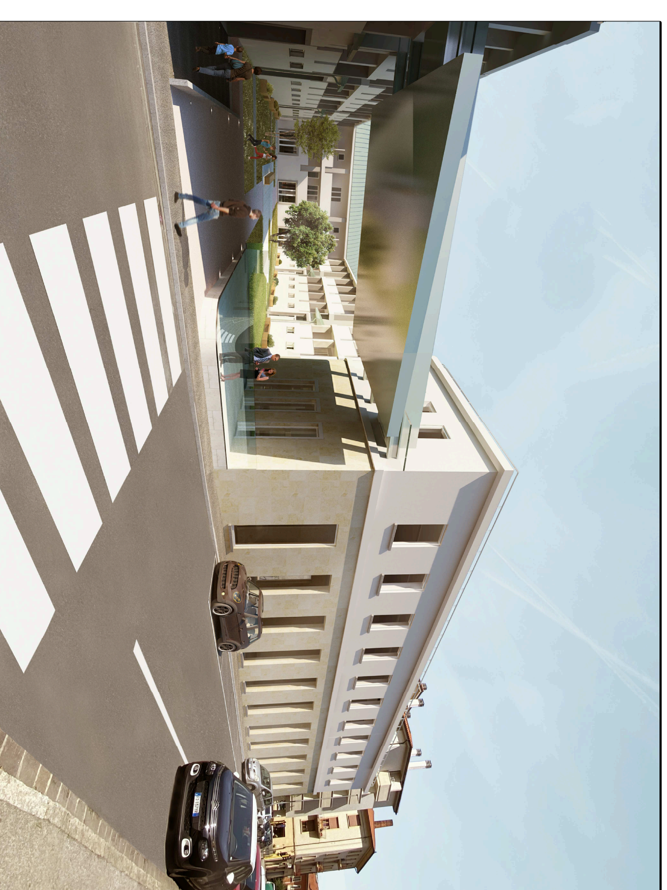
VISTA n.4 - Lato Via del Romito