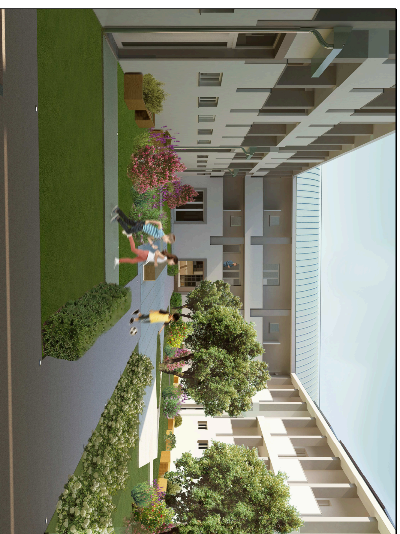
VISTA n.3 - Corte Interna