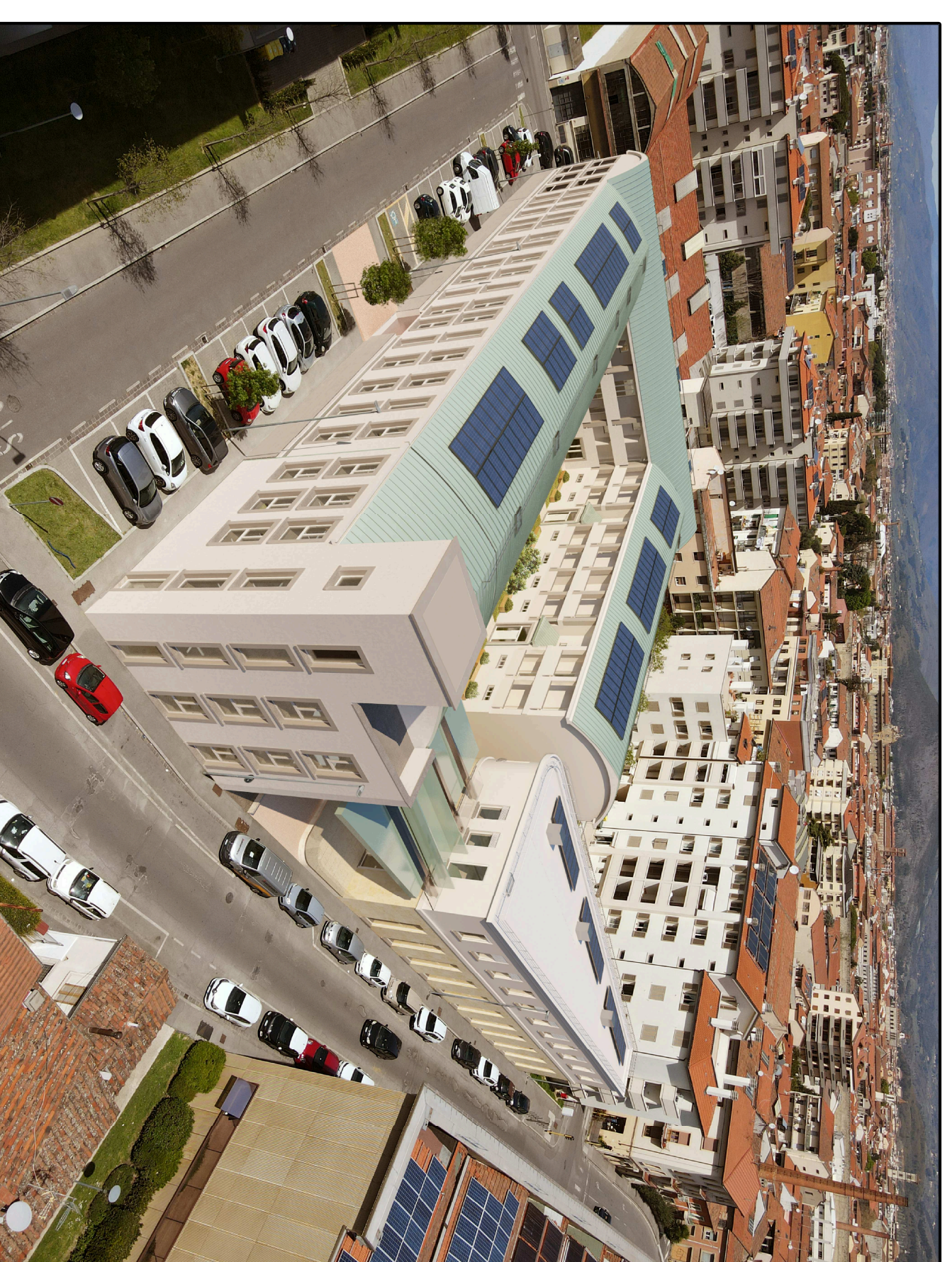
VISTA n.1 - Dall'alto su Via del Romito