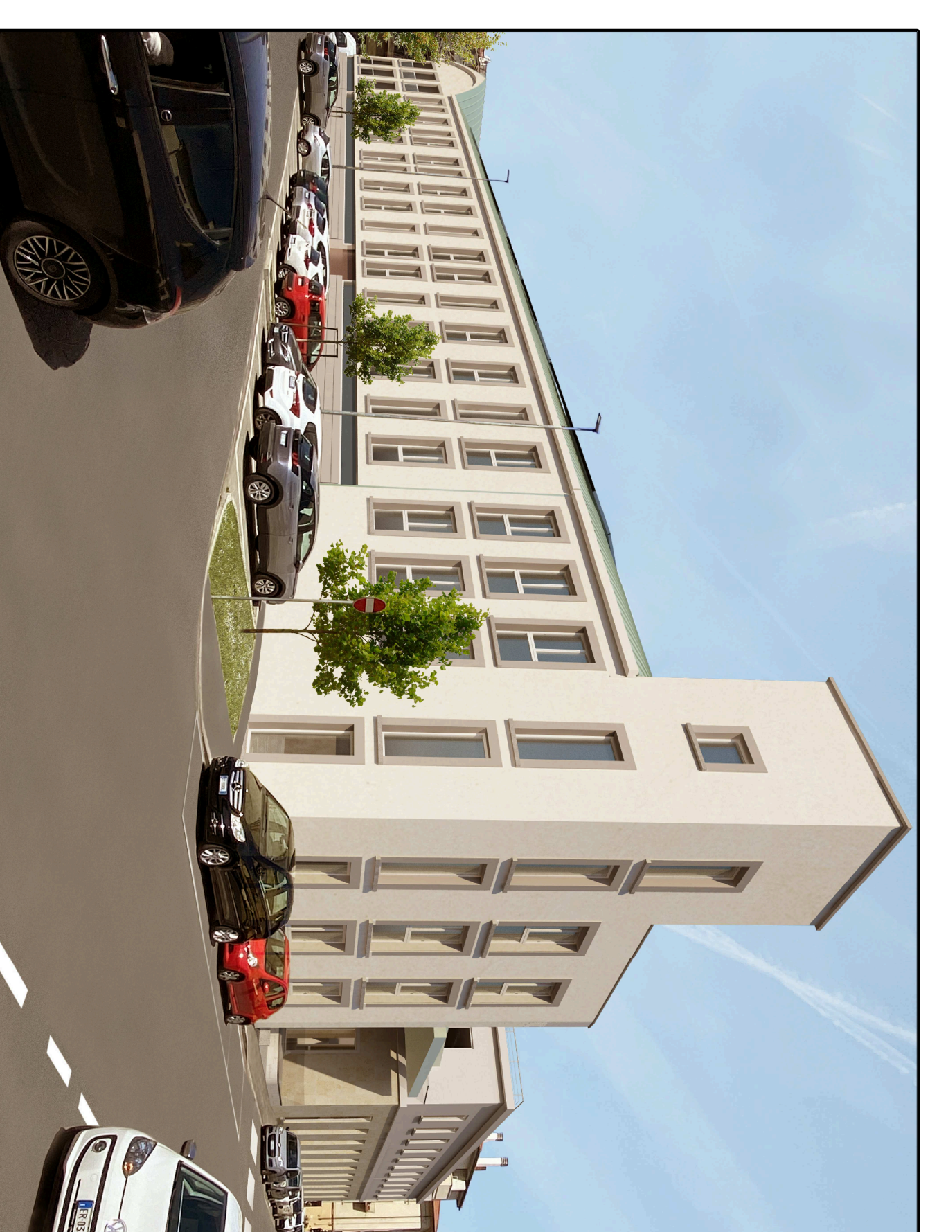
VISTA n.1 - Lato Via del Romito