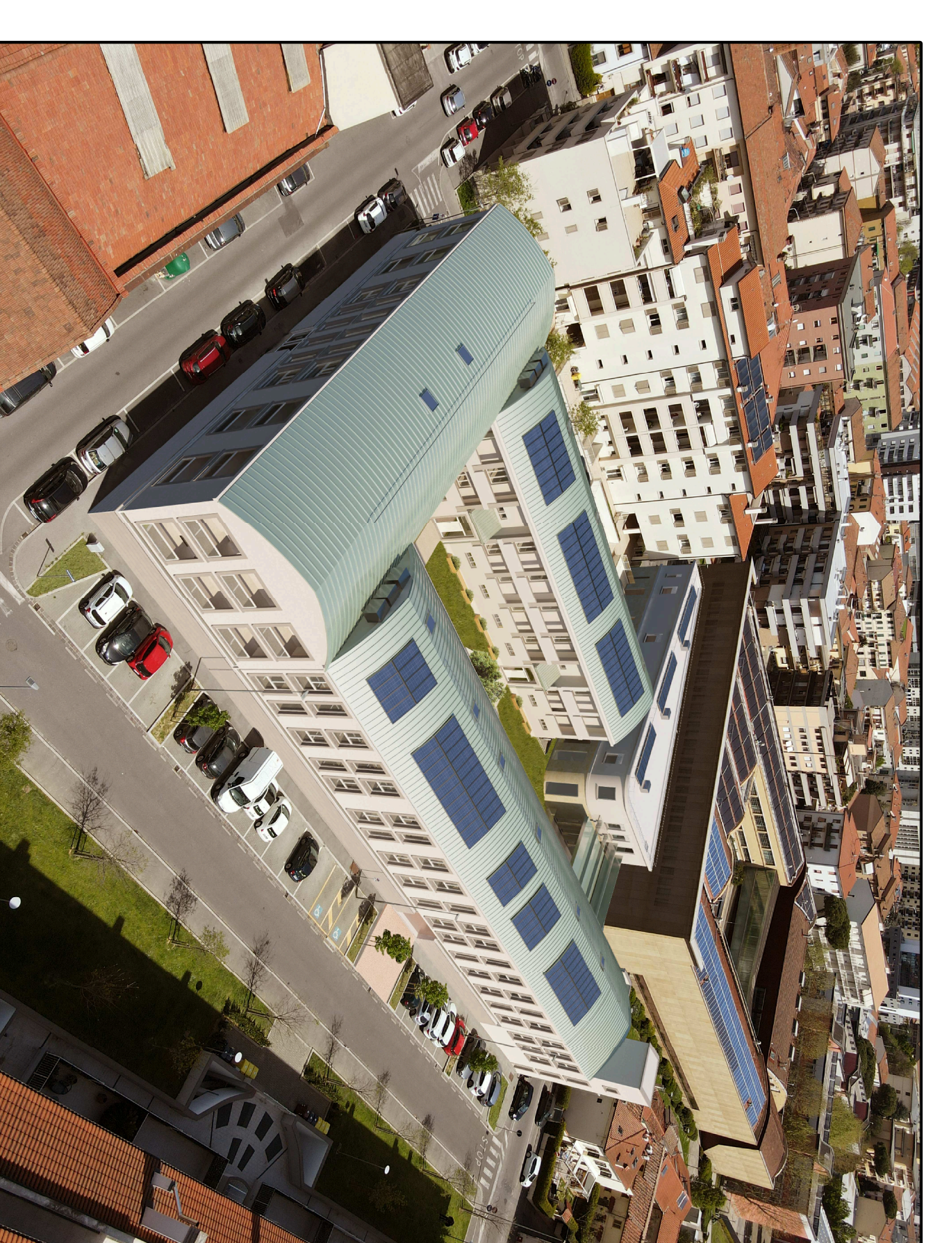
VISTA n.2 - Lato Sud Via V. Vestri