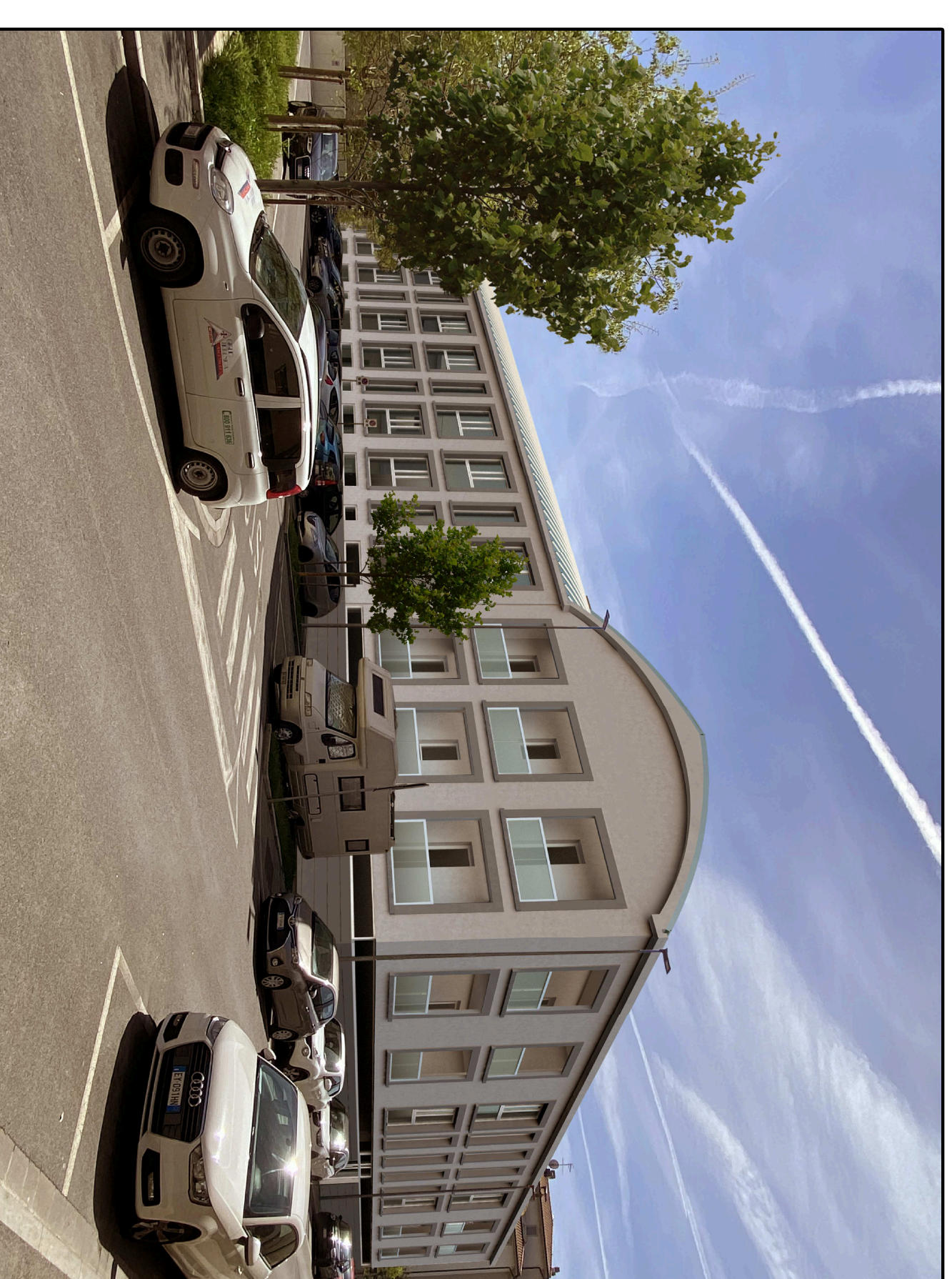
VISTA n.5 - Lato Nord Via V. Vestri