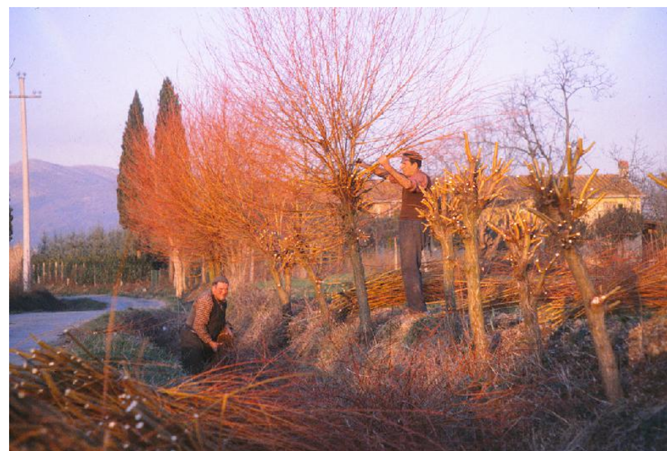
Foto scattata dal Geom. Panerai in via della Rugea negli anni 70. I due contadini scapitozzavano i salici posti lungo la strada per ricavarne legature per le viti. In altre zone della strada, come in tutte le strade dell'area, erano piantati anche pioppi scapitozzati per ricavare pali. Nel capitozzo dei pioppi, dopo ogni pioggia primaverile e autunnale, nascevano abbondanti funghi alberelli, detti anche leccini, molto apprezzati dagli abiatni dell'area.