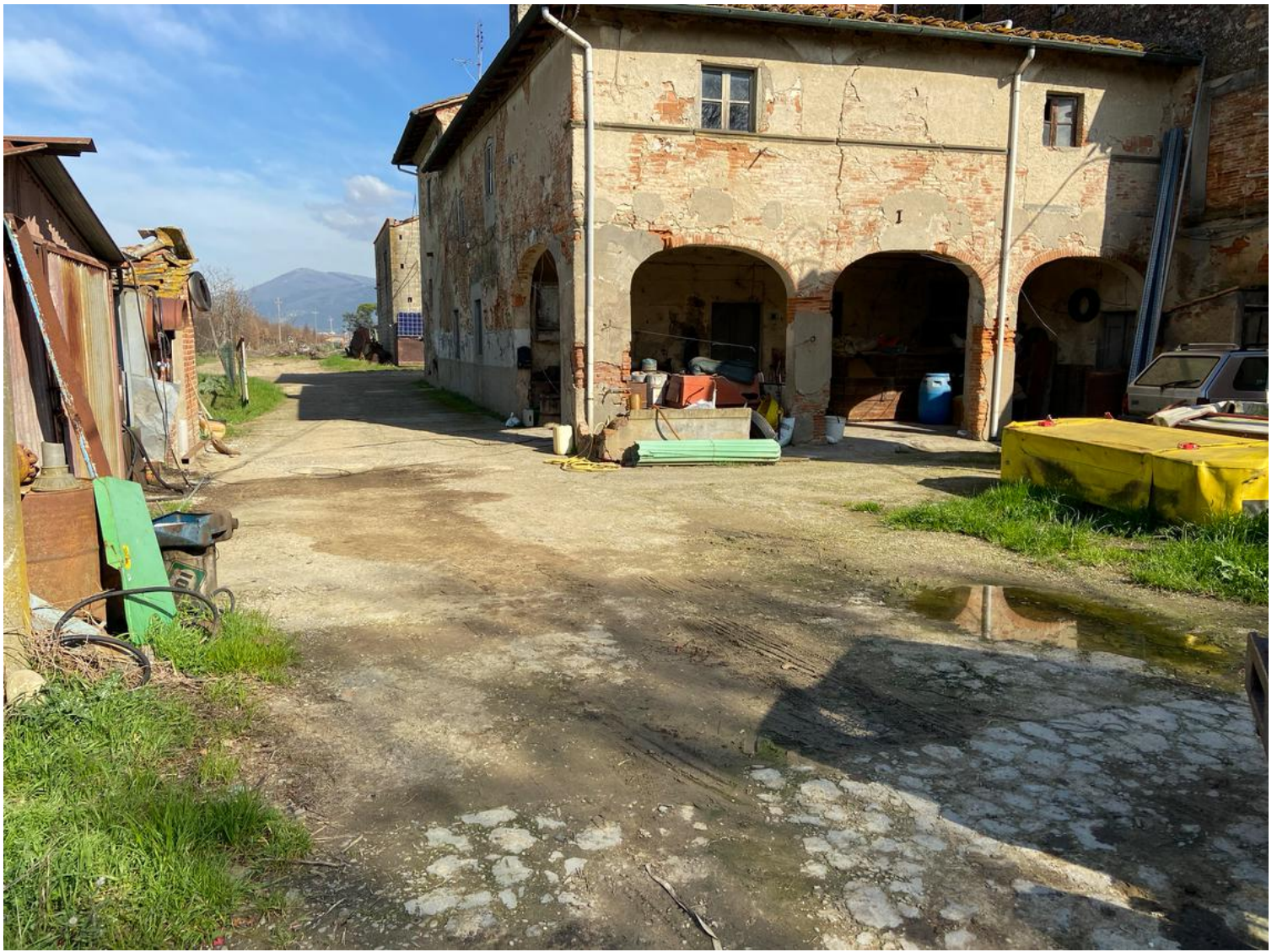
Resti di pavimentazione in cemento sulla corte ovest