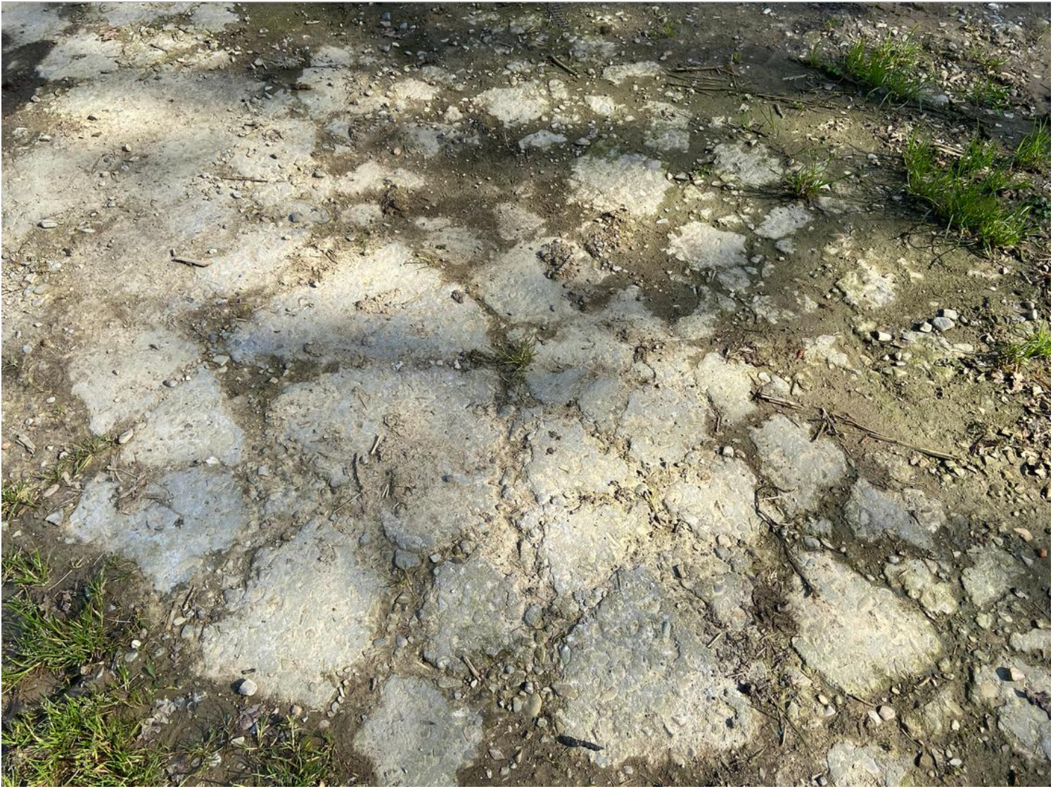
Stato di conservazione medio della pavimentazione in cemento