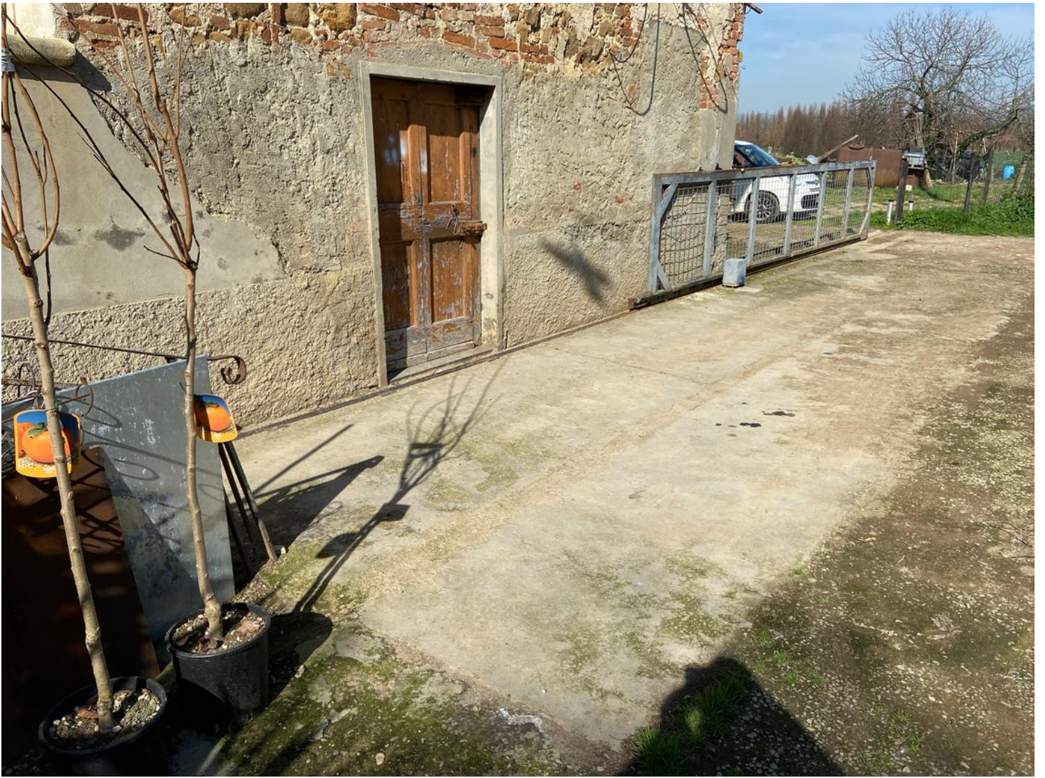
Pavimentazione in cemento sul prospetto principale