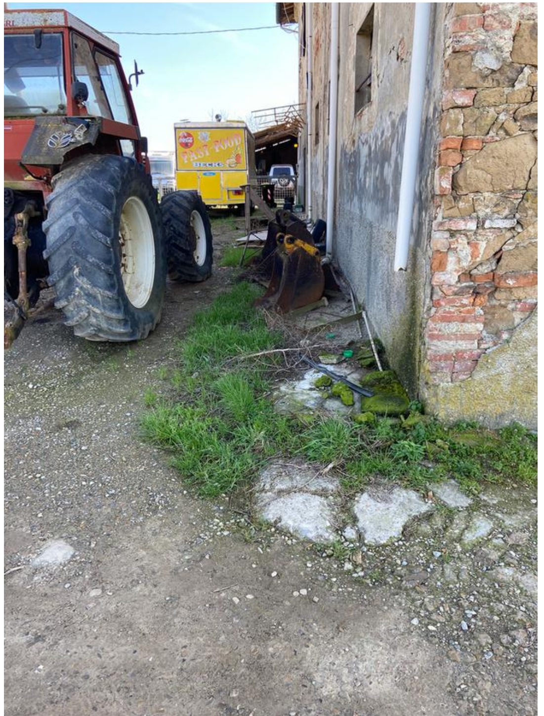
Resti di marciapiede in cemento sul prospetto nord