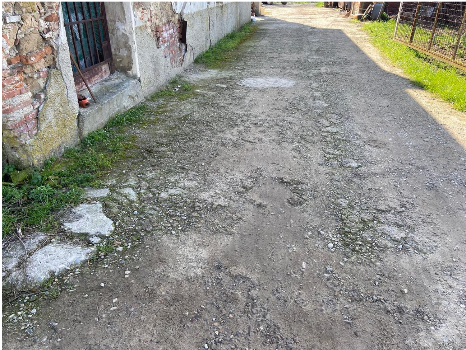
Resti di pavimentazione in cemento sul prospetto ovest