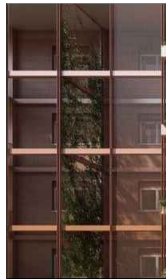
Particolare schermatura costituita da telaio in acciaio e rete metallica stratata

N.B. Tutti i locali in funzione della loro destinazione rispettano per dimensione, altezze, superfici, esposizione, illuminazione e aereazione, le prescrizioni del regolamento edilizio. - Finestre con apertura immediata e diretta - Rapporti aerilluminanti > 1/8 della superficie utile - Ventilazione trasversale unità 3-4-9-10 con sup. < di mq 75 - Ventilazione contrapposta unità con sup. > di mq 75 - Illuminazione media diurna FLDm > 2%