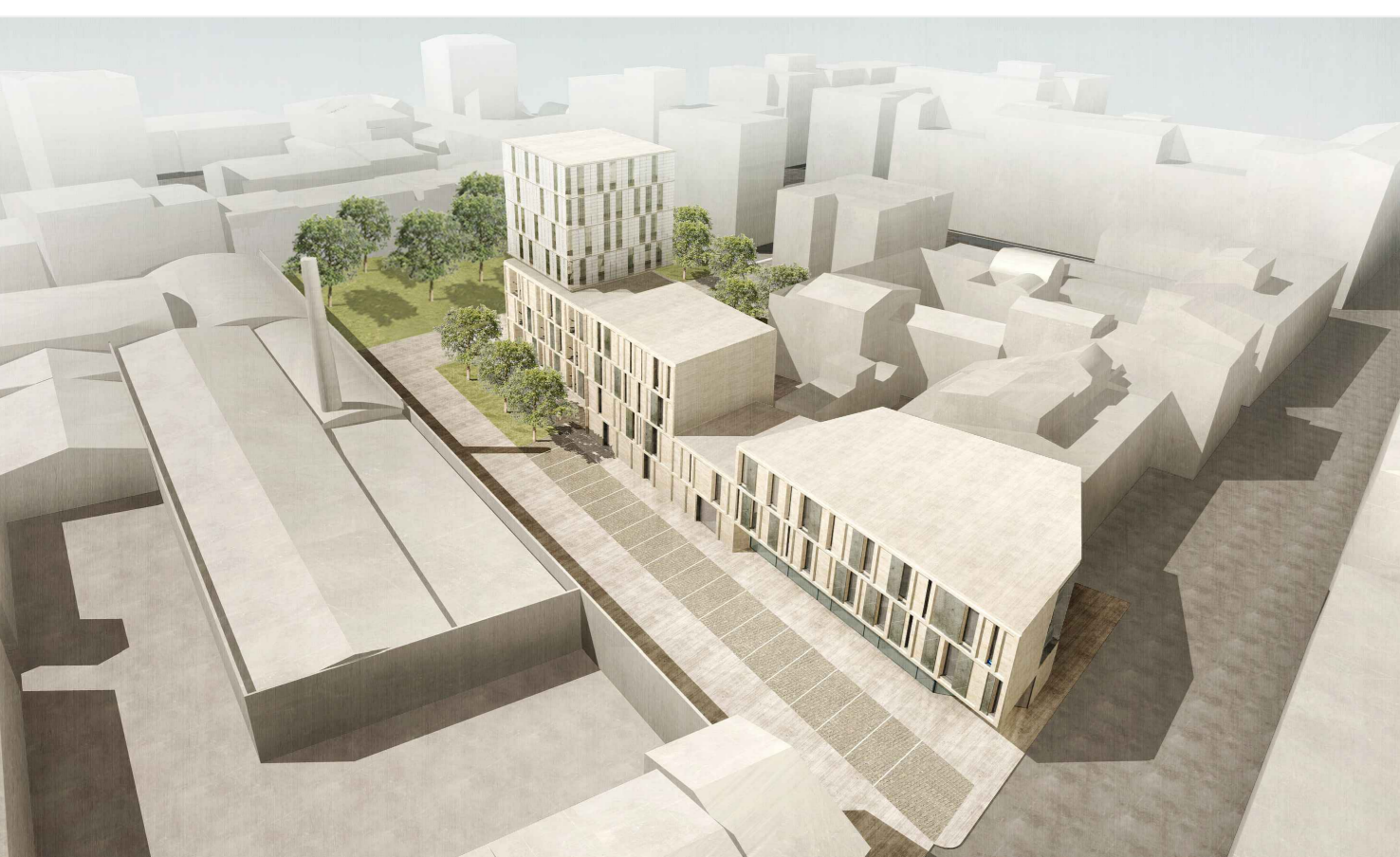
individuazione dei blocchi costruiti scala 1:2000

progettisti: arch. Alessandro Corradini con studio in via del Cassero, 16 - 59100 Prato (mda architetti) geom. Saverio Marseglia con studio in via dell'Aberaccio, 66/a - 59100 Prato