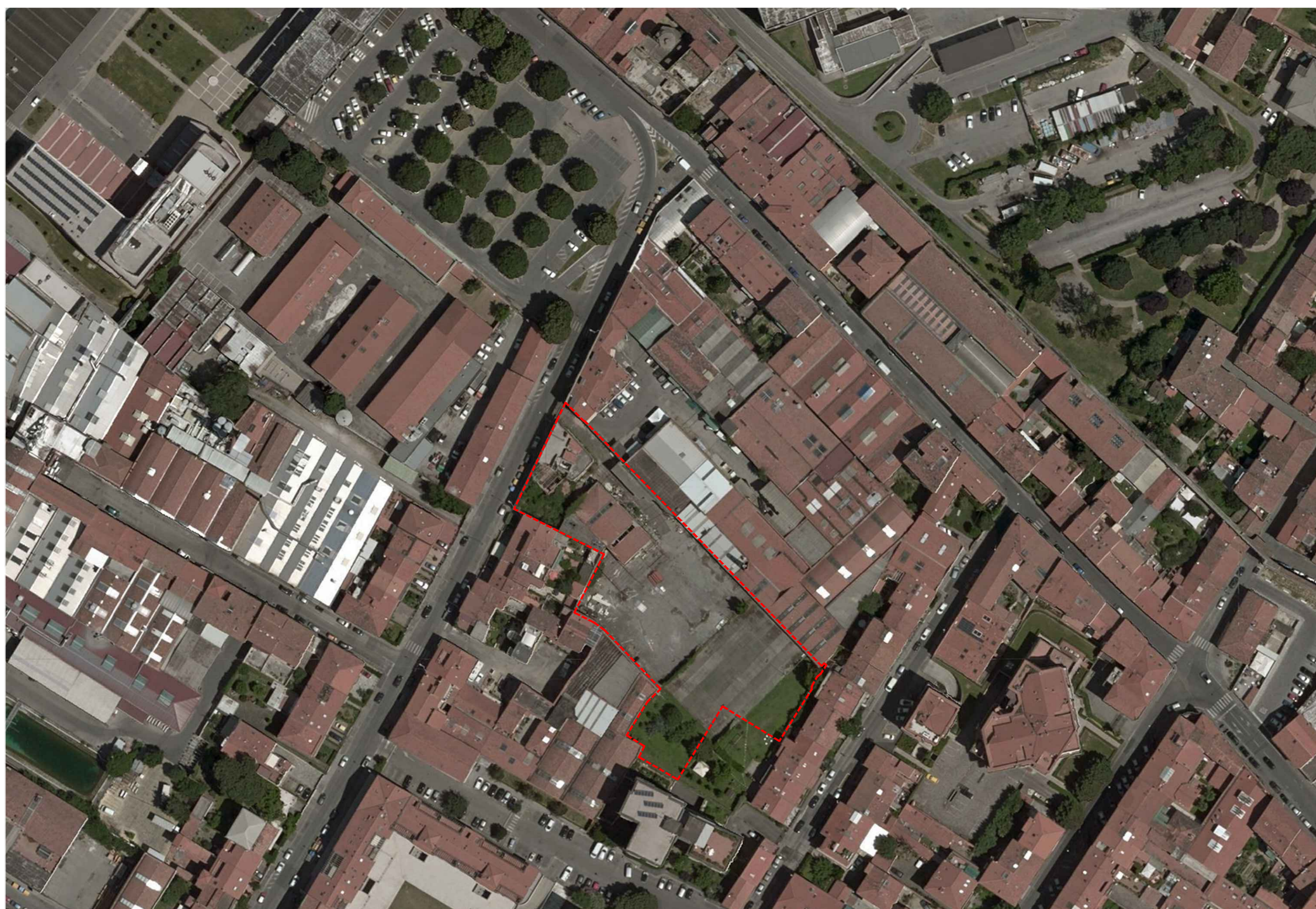
LEGENDA - - - limite lotto di intervento