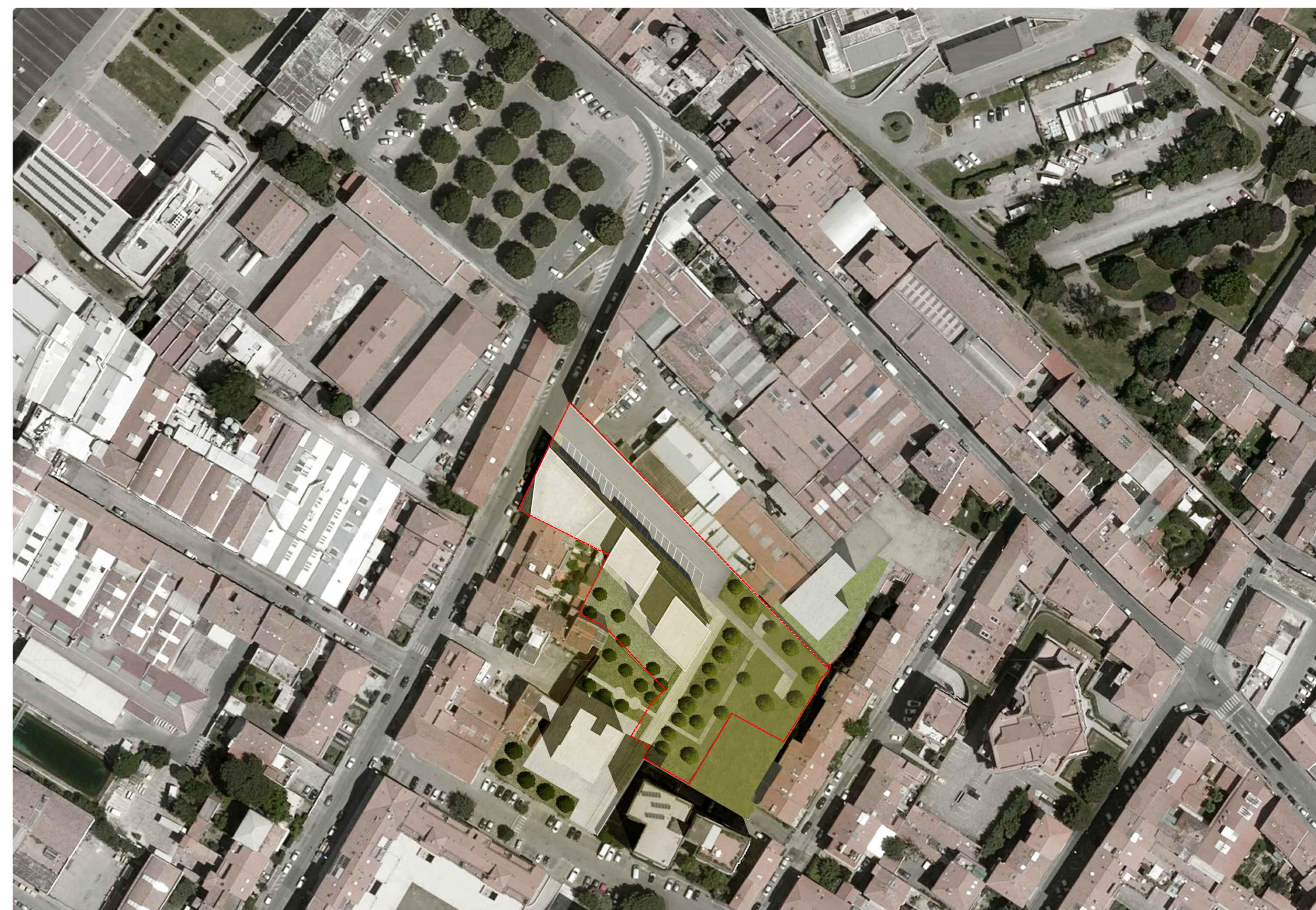
LEGENDA - - - limite lotto di intervento