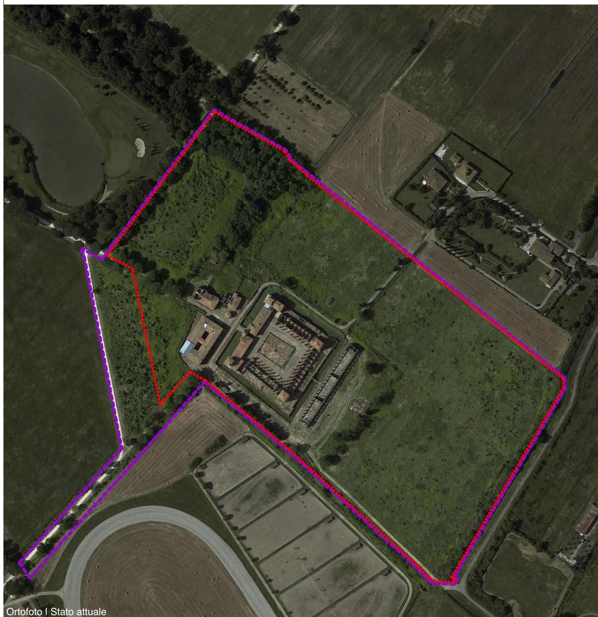
Ortofoto | Stato attuale