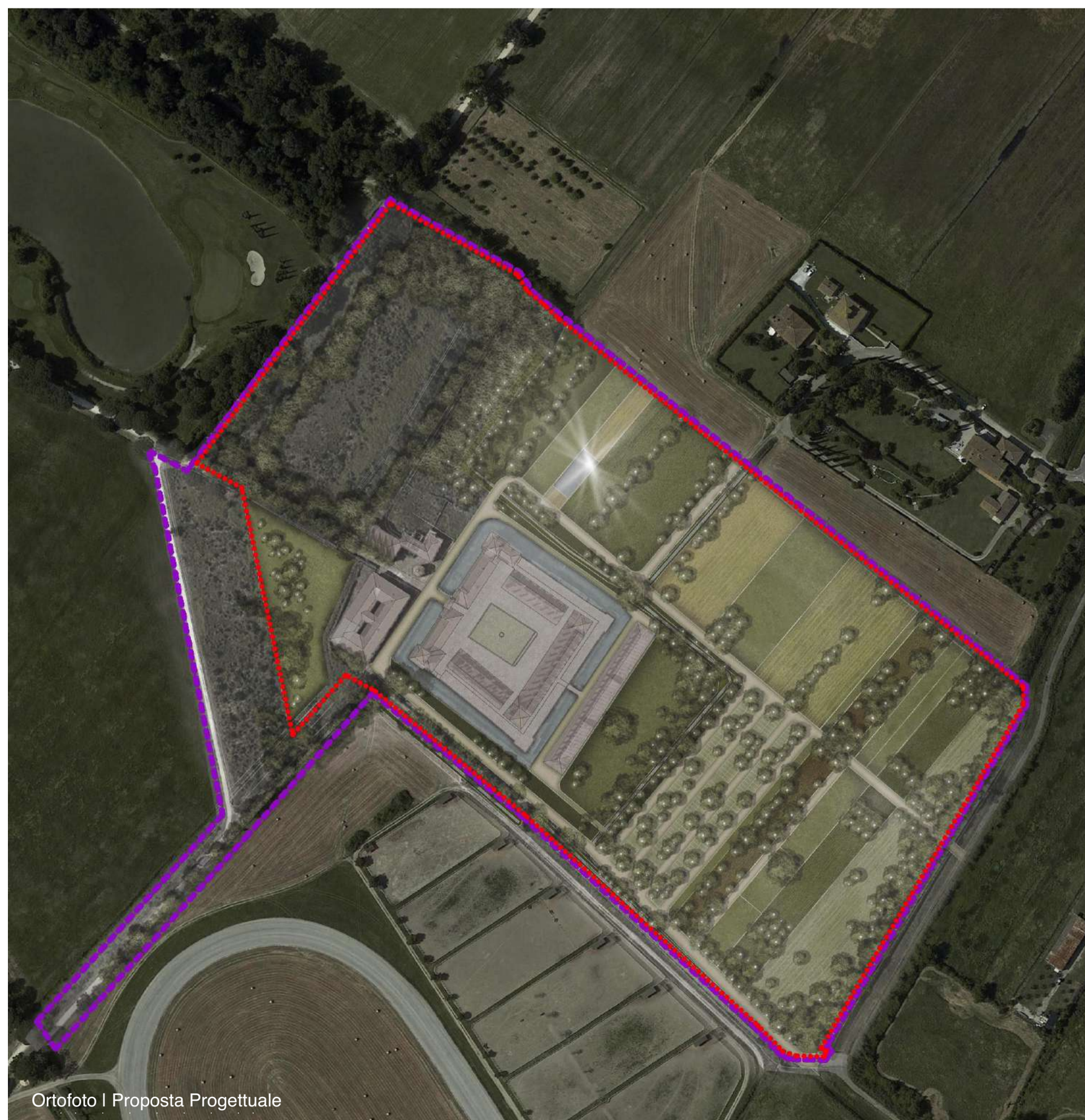
Ortofoto | Proposta Progettuale

..... Perimetro Piano Attuativo in Variante al P.O. coincidente con Proprietà Ciottoli Immobiliare