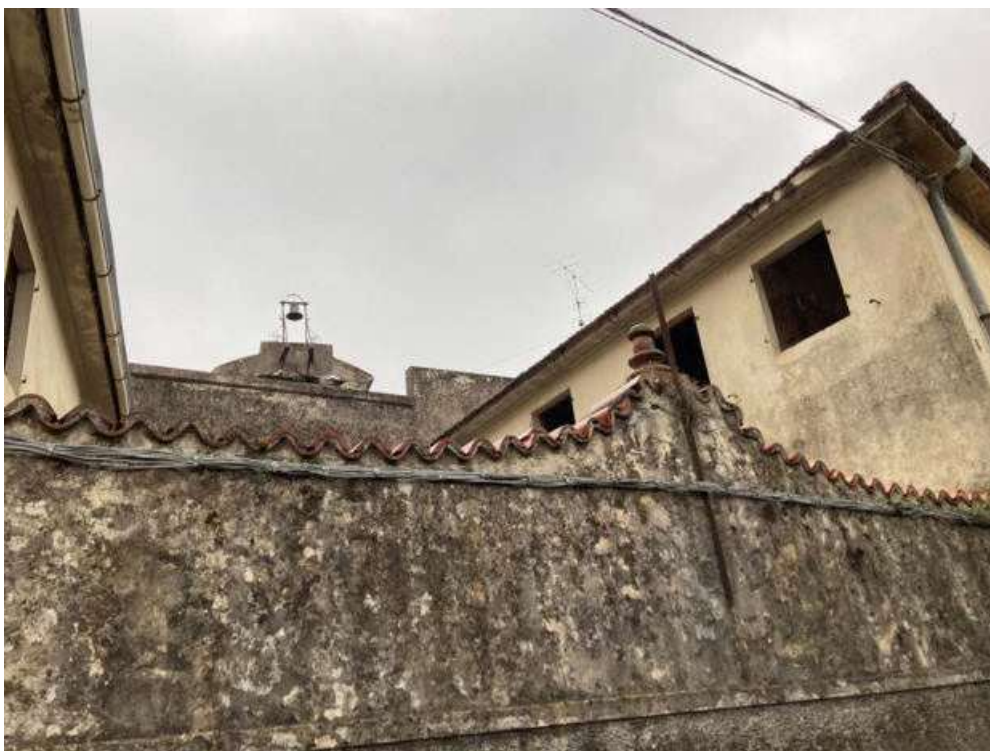
Vista 12 prospetto della Villa su Via Della Chiesa di Santa Cristina in corrispondenza della corte interna