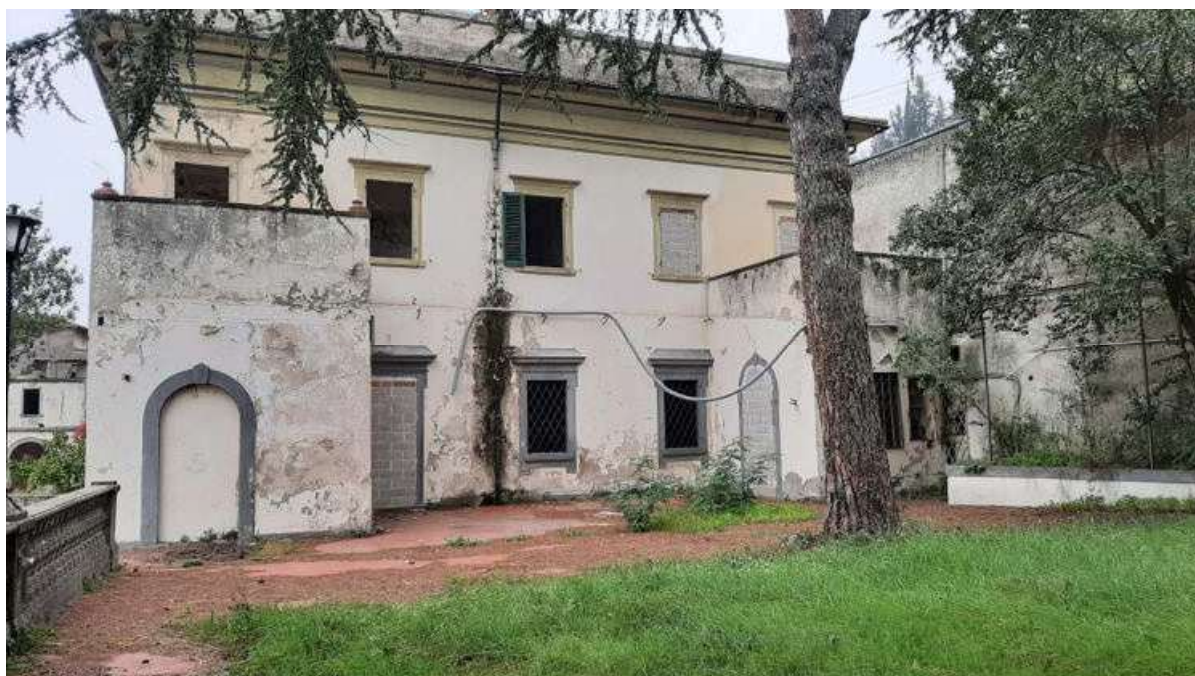
Vista 02 prospetto laterale Villa