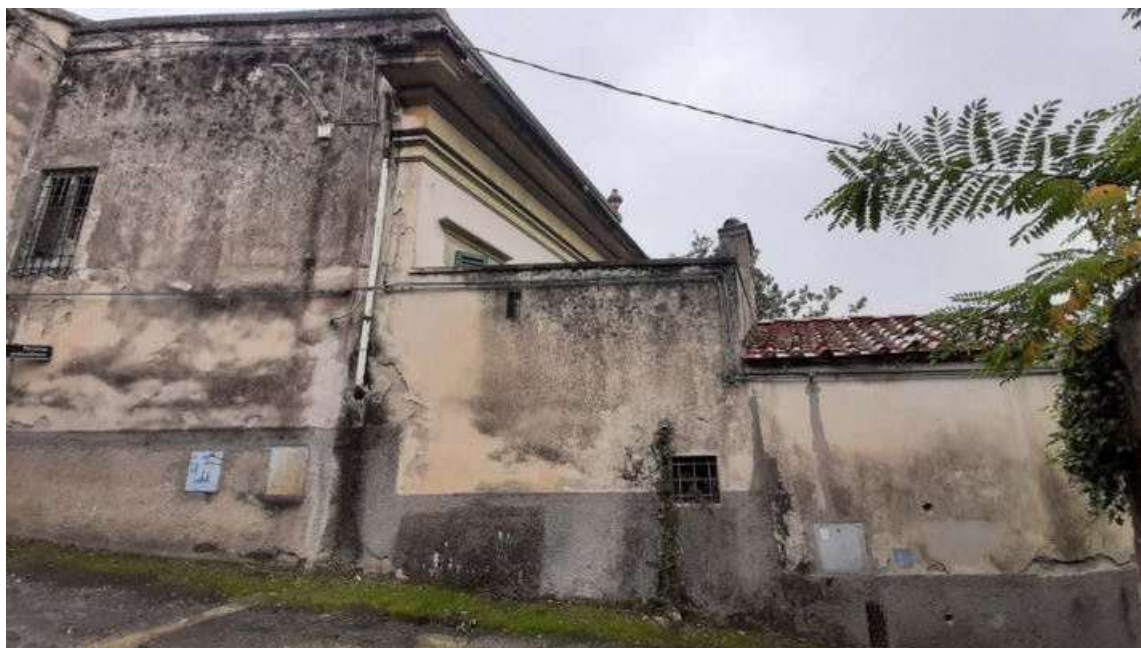
Vista 09 - prospetto della Villa su Via Della Chiesa di Santa Cristina