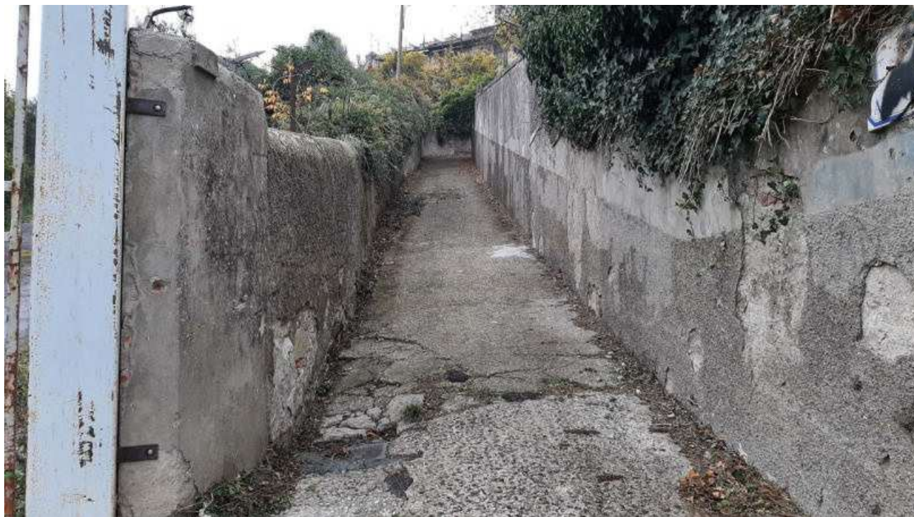
Vista 05 - Via Della Chiesa di Santa Cristina