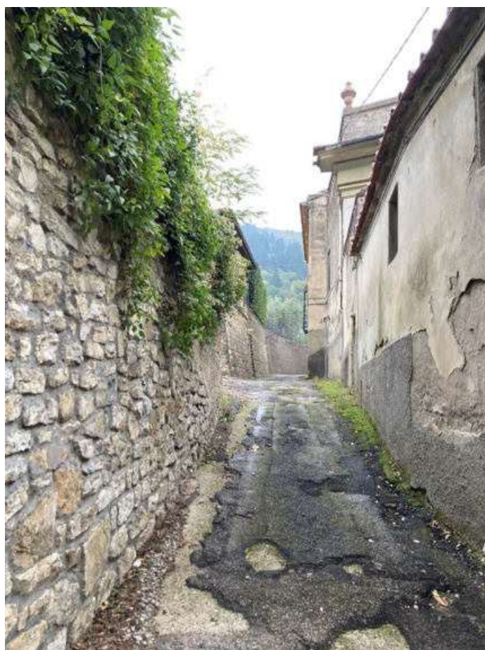
Vista 08 - Via Della Chiesa di Santa Cristina