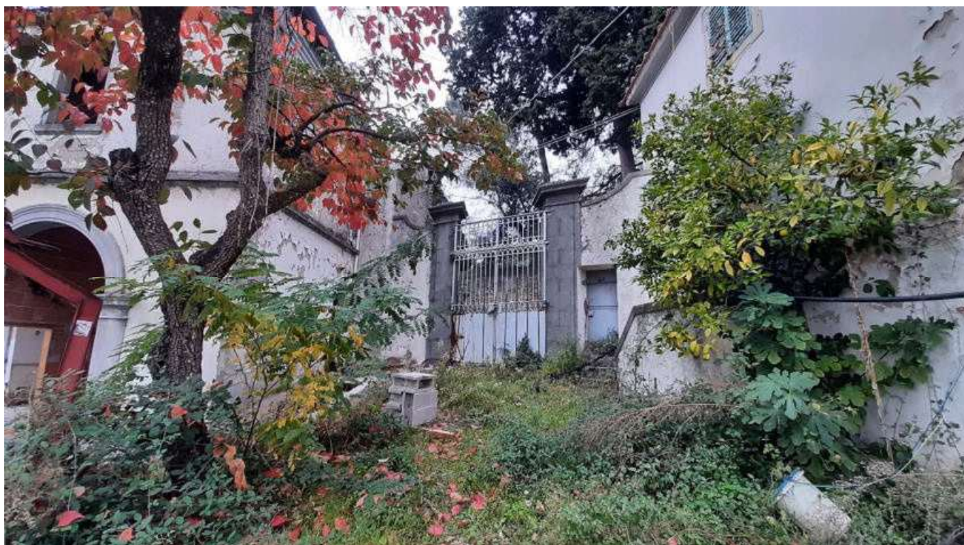
Vista 04 prospetto interno – ingresso laterale tra edificio C e Villa