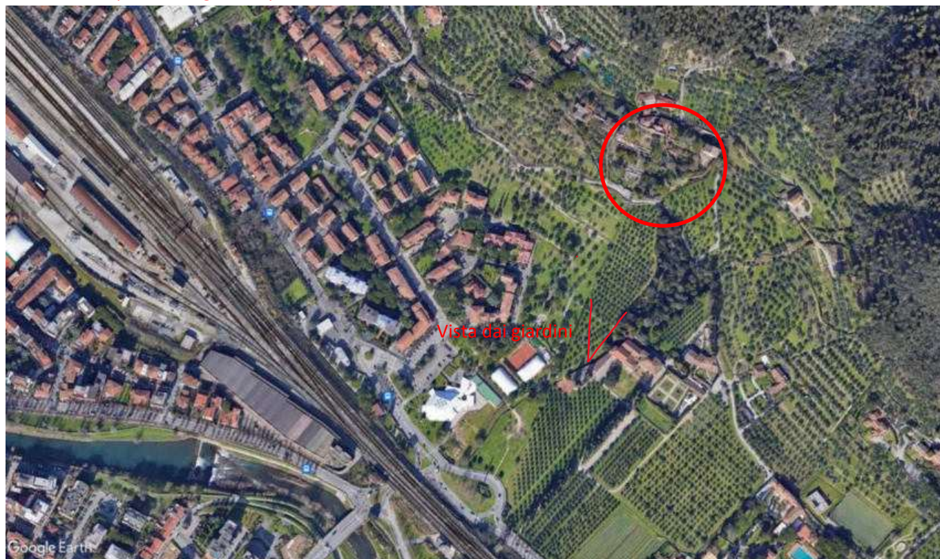
INQUADRAMENTO COMPLESSO DI SANTA CRISTINA