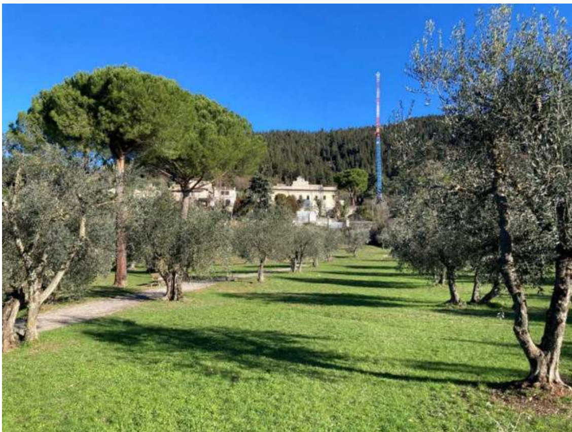
Vista del complesso dai giardini pubblici