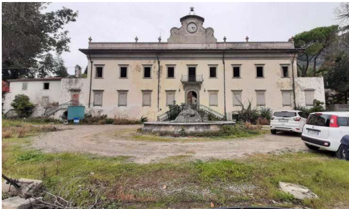
Vista 01 facciata principale della VILLA