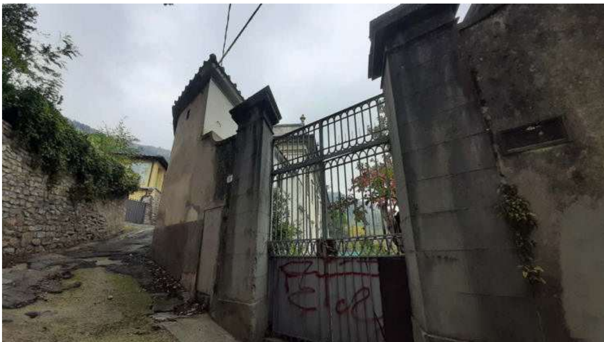
Vista 07 - Via Della Chiesa di Santa Cristina – ingresso laterale