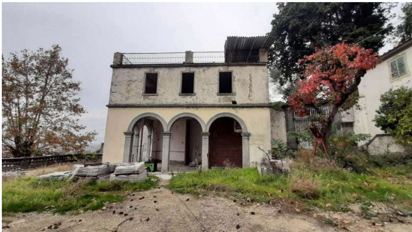
Vista 03 prospetto Edificio C- Limonaia