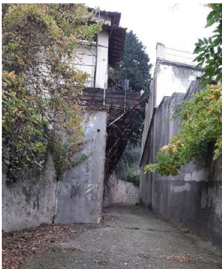
Vista 06 - Via Della Chiesa di Santa Cristina in corrispondenza Edificio CME - Limonaia