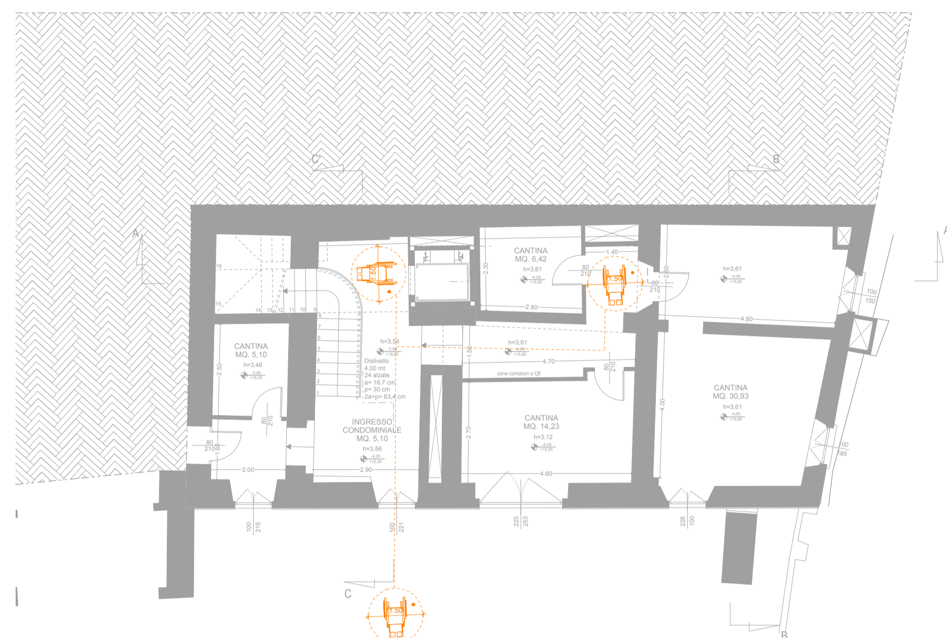
PIANTA PIANO SEMINTERRATO