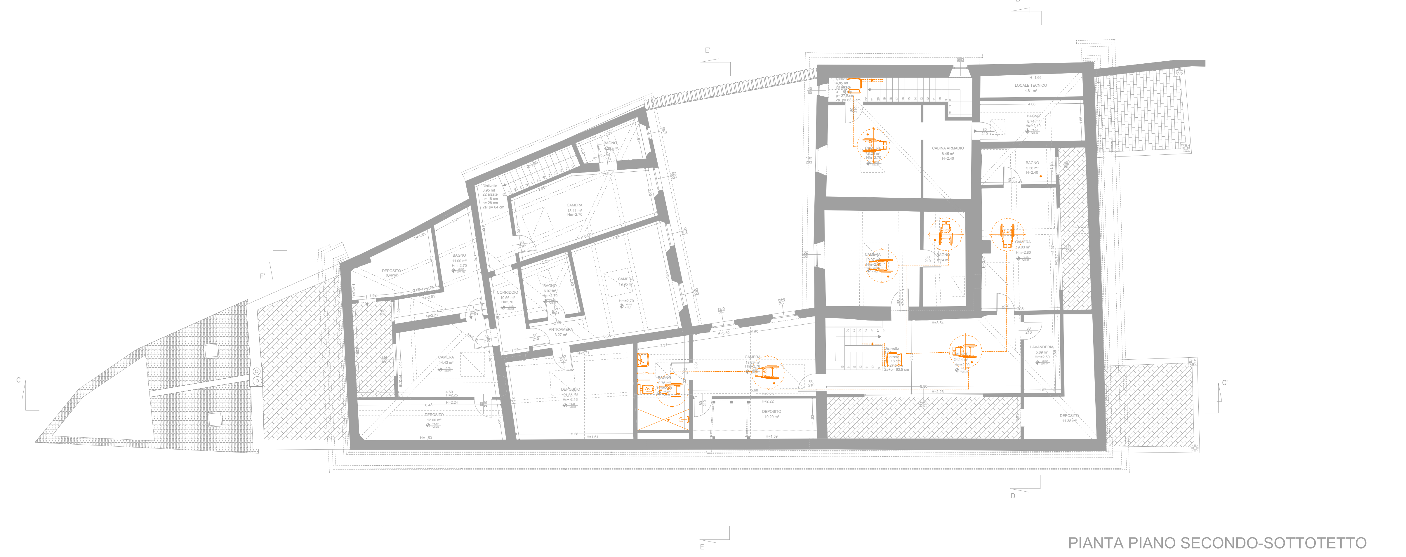
PIANTA PIANO SECONDO-SOTTOTETTO