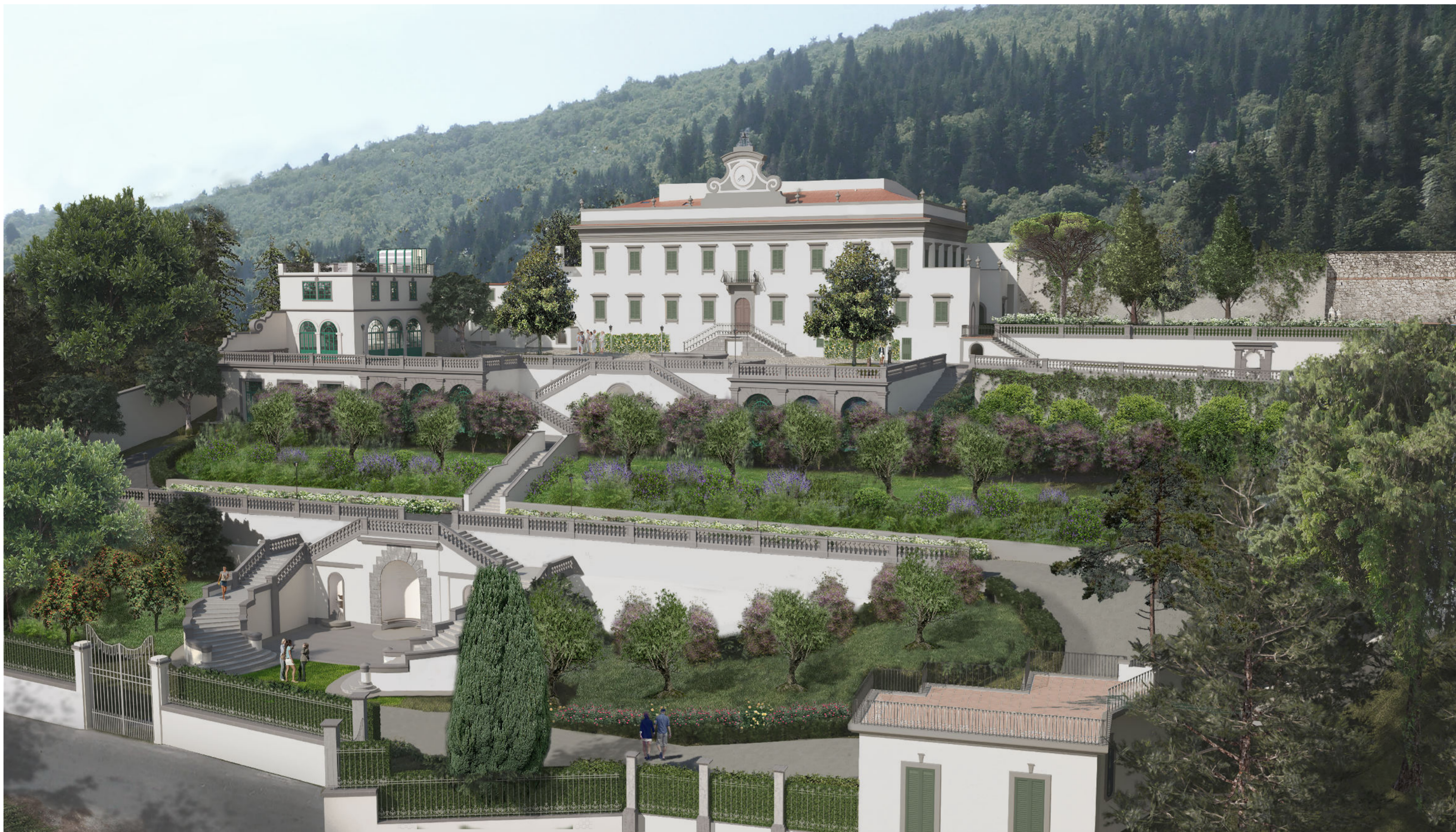
Vista generale del Complesso di Santa Cristina