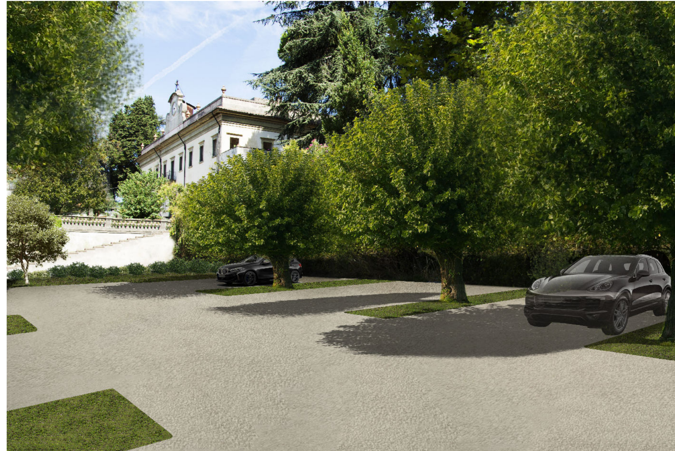
Area di Parcheggio di progetto