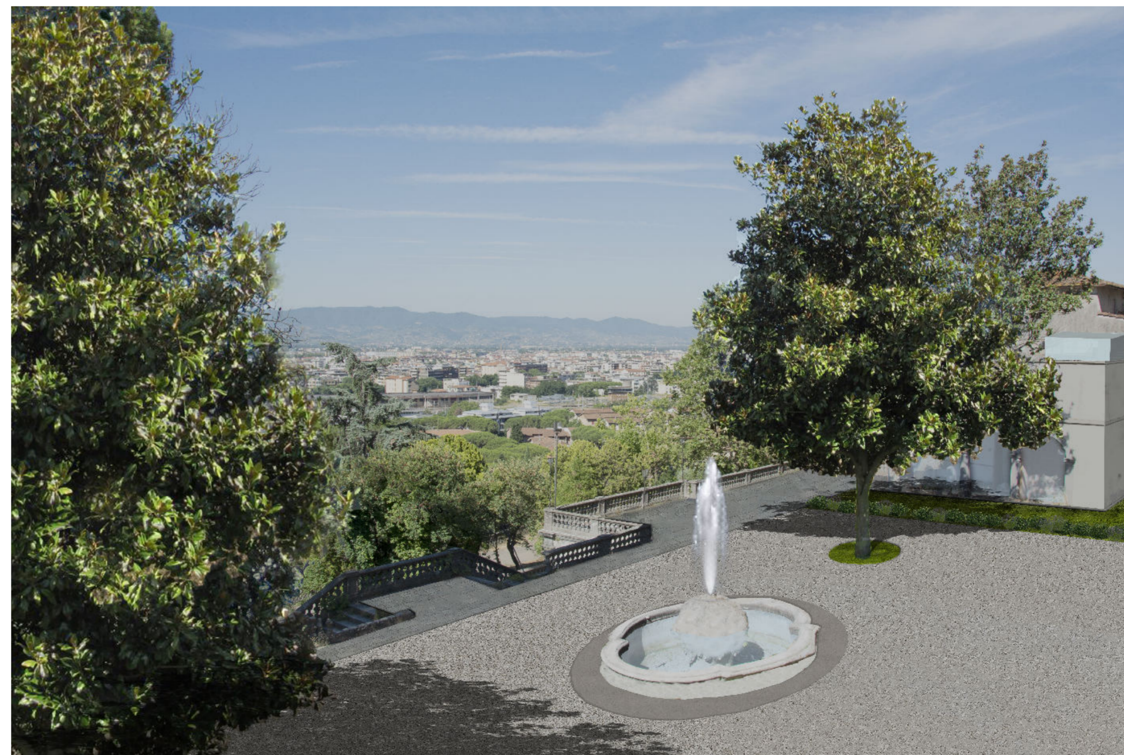
Sistemazione Piazza antistante la Villa