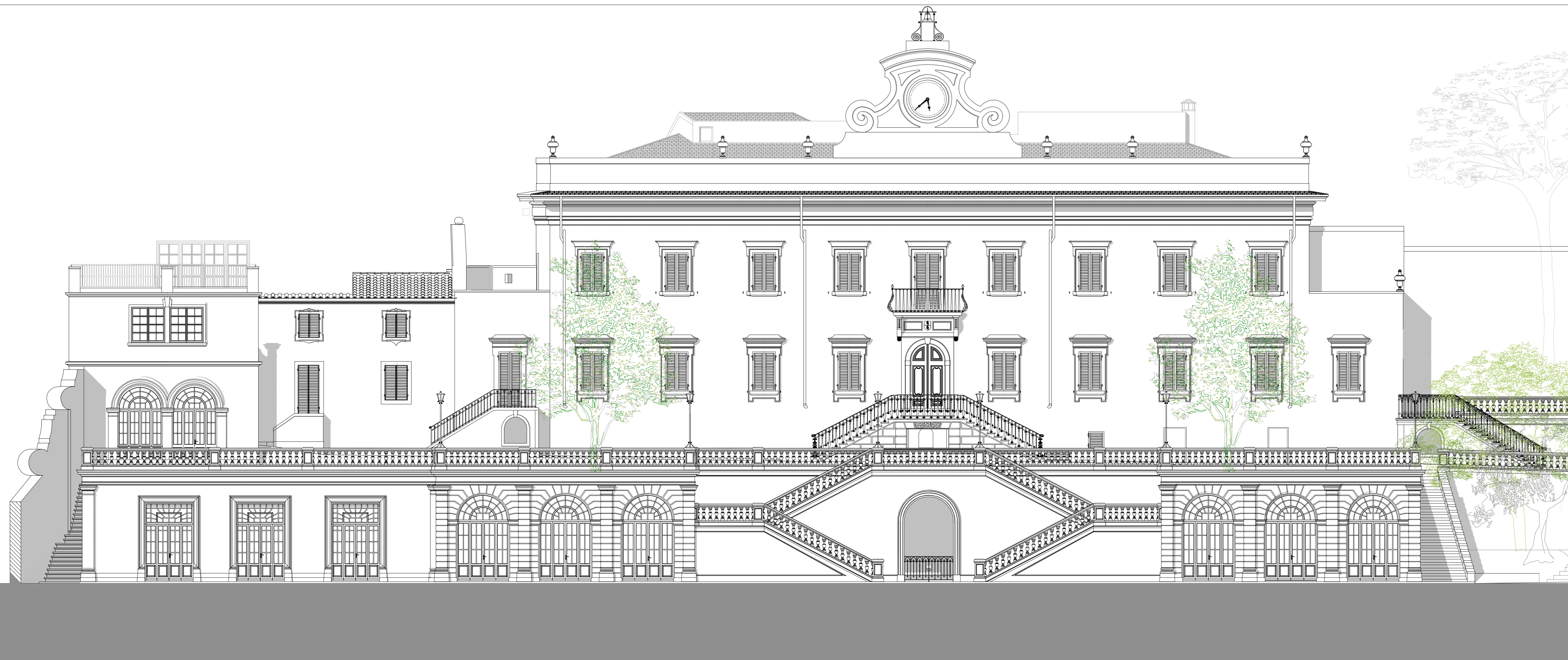
SEZIONE C - C