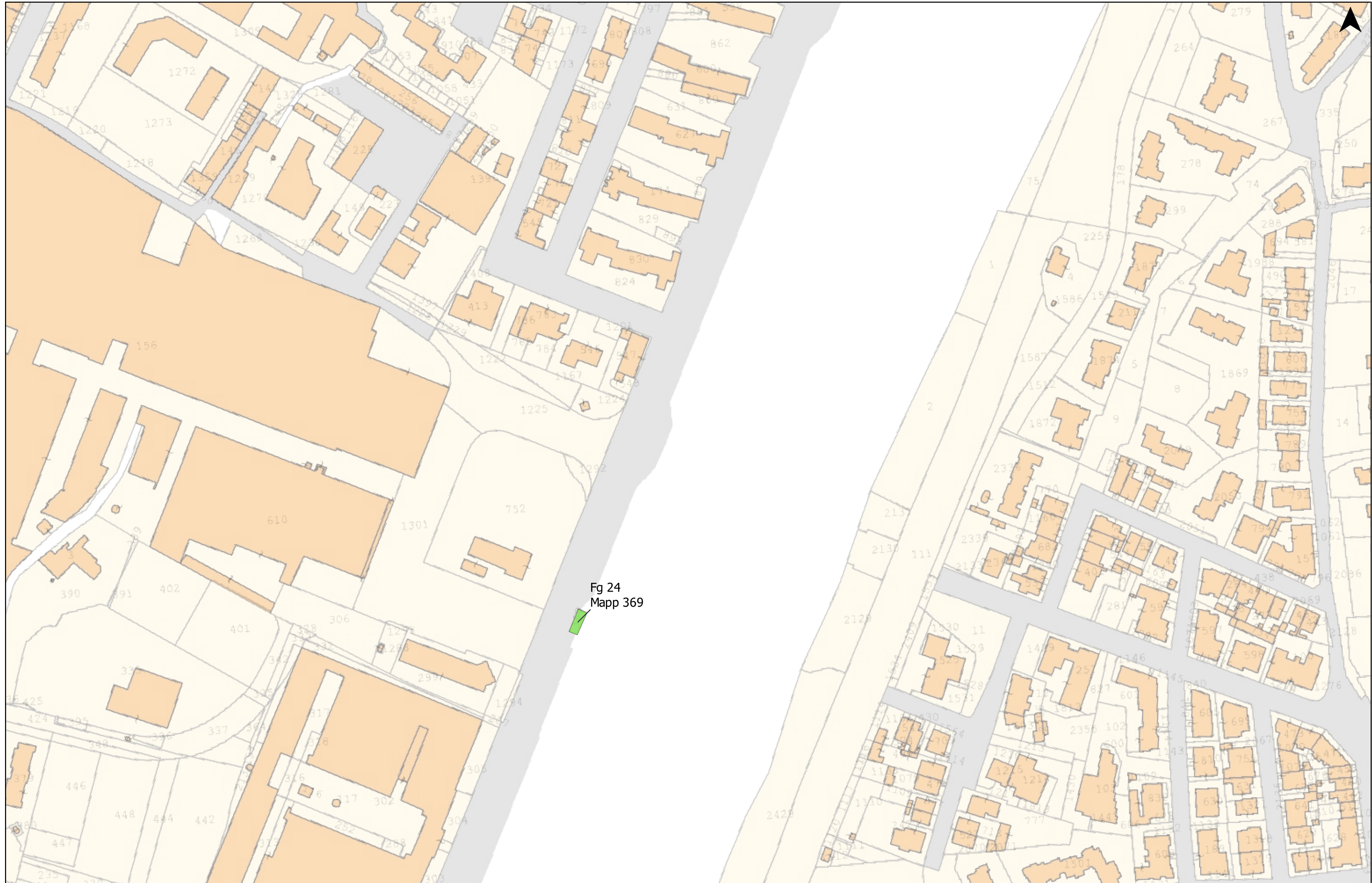
Fig 24 Mapp 369