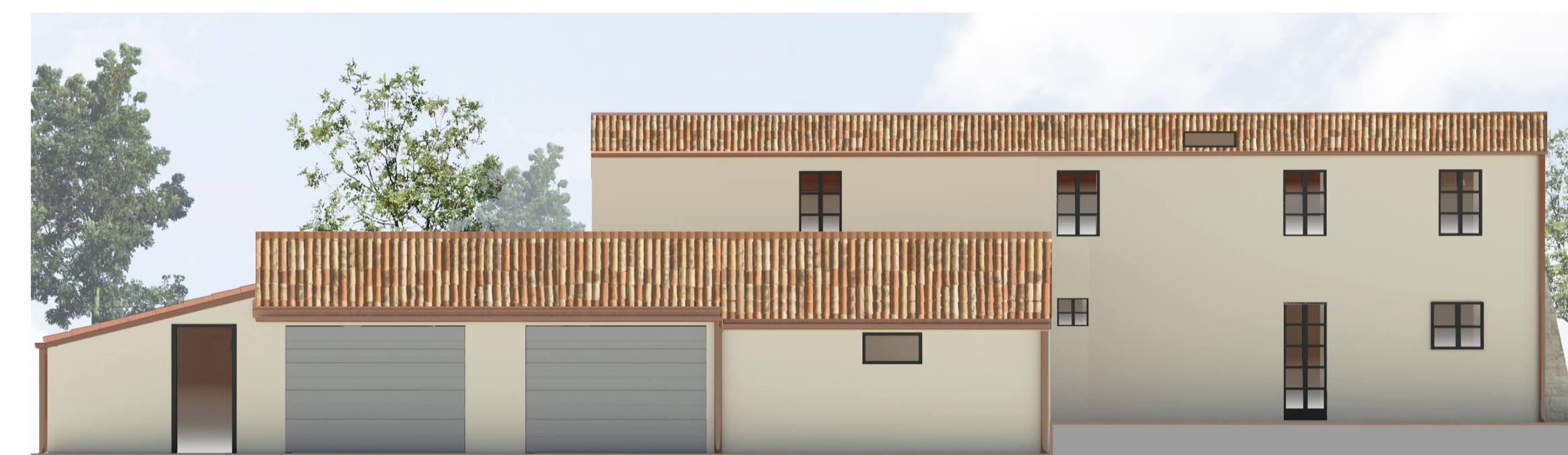
PROSPETTO SUD OVEST