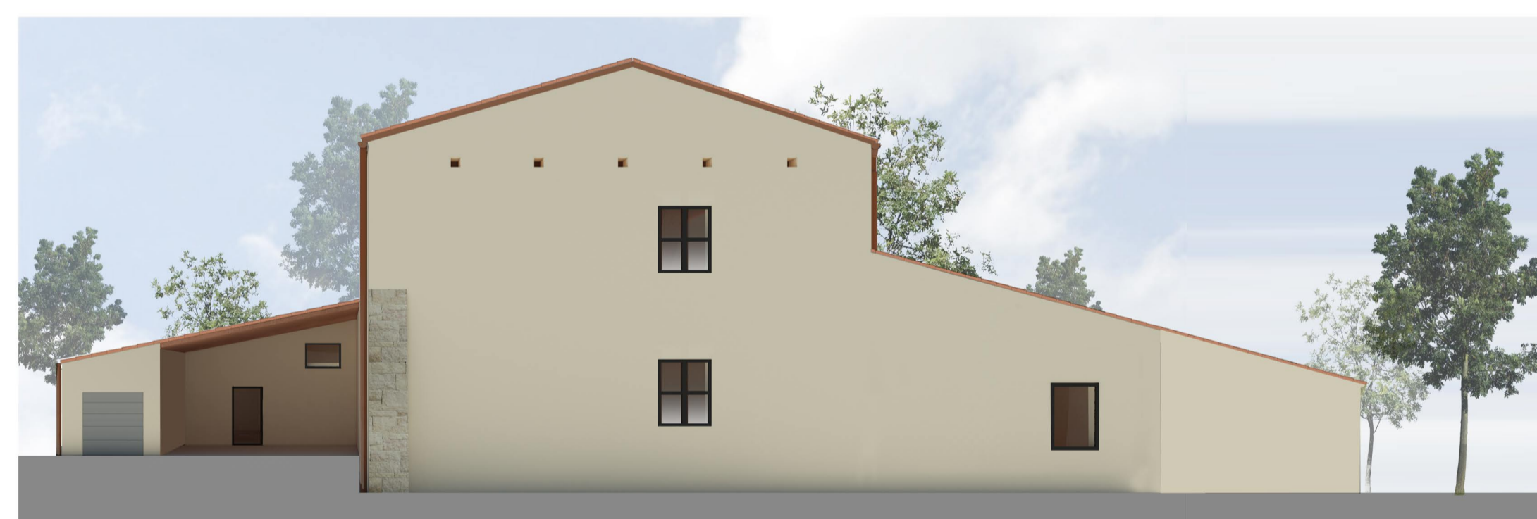
PROSPETTO SUD EST