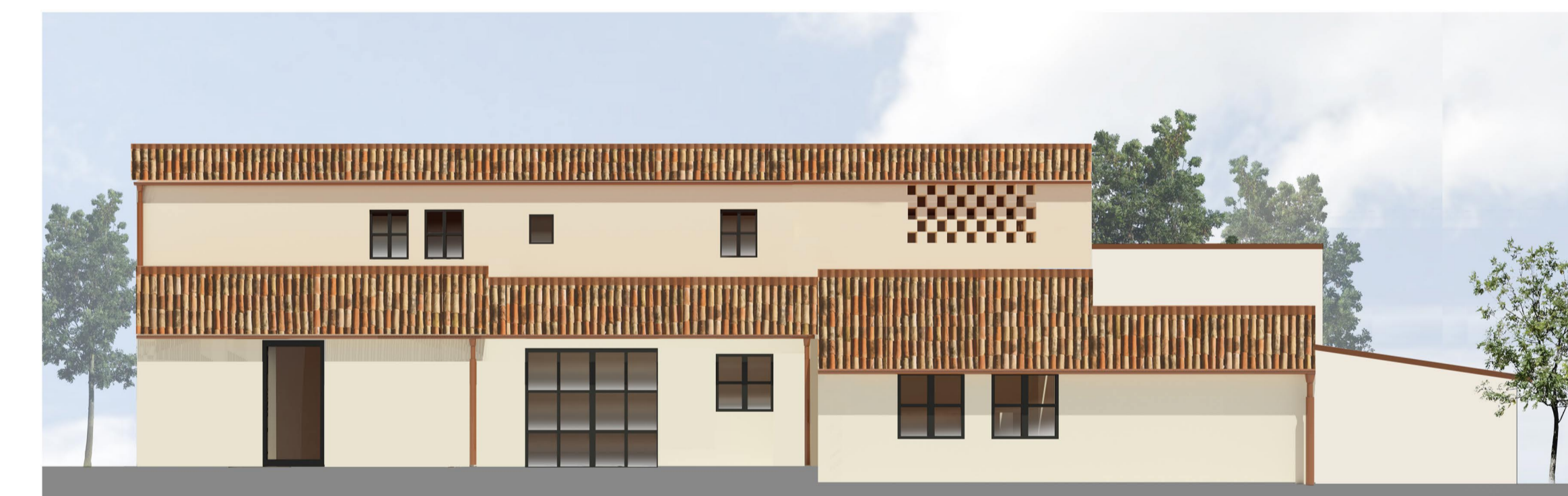
PROSPETTO NORD EST