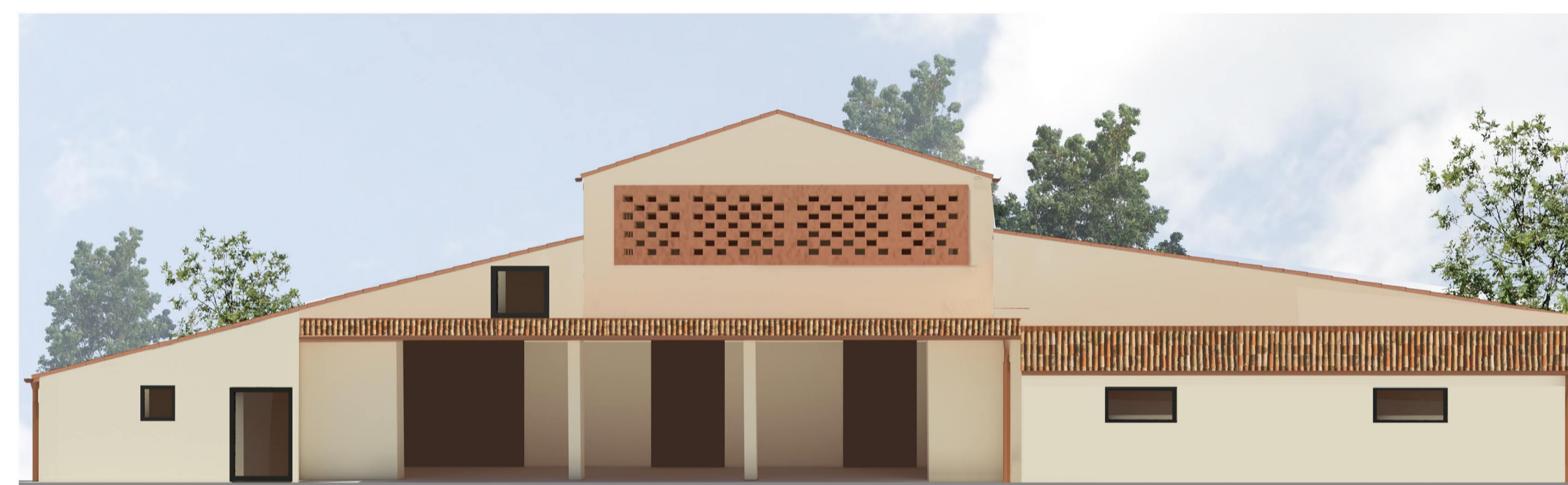
PROSPETTO NORD OVEST